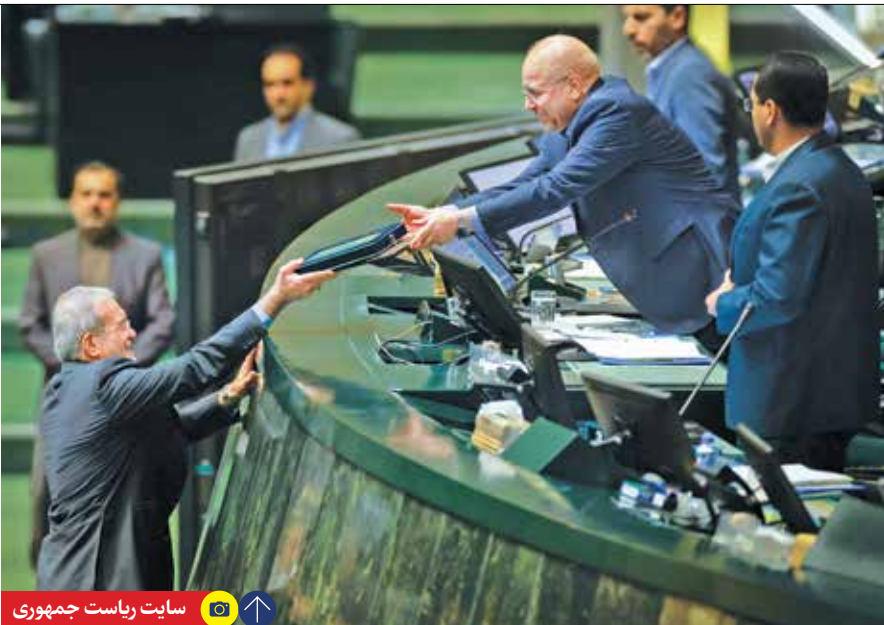
سایت ریاست جمهوری

رئیس‌جمهور با یادآوری انتقاد کارشناسان به وجود موارد فرابودجه‌ای در لوائح بودجه سالیان گذشته، احصای تمامی موارد منابع و مصارف از جمله مصارف سازمان