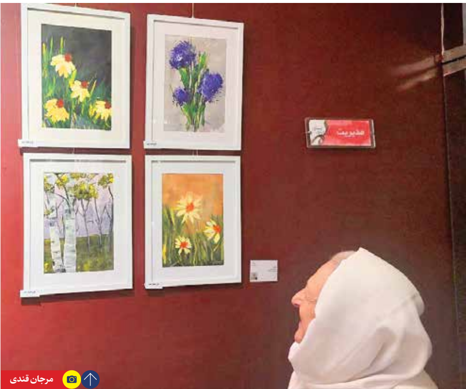
نمایشگاهی از تابلوهایی نقاشی مادر بزرگ‌ها و پدر بزرگ‌ها که امید را به تصویر می‌کشند

جمع را تغییر می‌دهد. پیرمردی از پله‌ها بالا می‌آید؛ وقتی وارد سالن می‌شود چنان به نفس نفس می‌افتد که برای چند لحظه حالش بد می‌شود و دستش را روی قلبش می‌گذارد. اما بنا چند نفس جانانه و با دیدن یاران قدیمی حالش بهتر می‌شود و درد را فراموش می‌کند. همه جمع می‌شوند تا در افتتاحیه نمایشگاه نقاشی «وقت زندگی» حضور داشته باشند؛ نمایشگاهی که به همت یکی از مراکز وابسته به بهزیستی برپا شد تا سالمندان