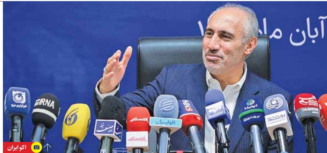
رئیس سازمان برنامه در پاسخ به «ایران» تأکید کرد