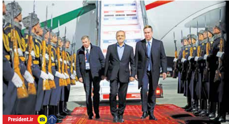
اهمیت این سفر را دو چندان کرده است.

رئیس جمهور در ادامه بخش های کشاورزی، انرژی، صنعت، تجارت و گردشگری را از جمله زمینه های موجود برای همکاری و تعامل میان کشورهای عضو بریکس عنوان کرد و افزود: این سفر فرصتی است که با رؤسای جمهور روسیه، چین، هند و تعداد دیگری از کشورها که در این اجلاس حضور دارند دیدار و گفت و گو داشته باشیم و راهکارهای همکاری و تعاملات و تبادلات بیشتر را بررسی کنیم. پزشکیان با تأکید بر اینکه هم افزایی و توسعه ارتباطات میان کشورهای بریکس گامی مؤثر در مسیر برون رفت از چالش یکجانبه گرایی، تمامیت خواهی و تحریم امریکا در جهان است، افزود: اولین بار است که ما به عنوان عضو اصلی در این اجلاس شرکت خواهیم کرد که