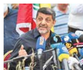
قهرمانانه زندگی کرد و اسطوره شد. وی همچنین با اشاره به اینکه «تعداد روزانه عملیات مقاومت در حال افزایش است و میانگین آن در روز حدود ۲۵ عملیات است»، گفت: هدف‌گیری شمال و عمق اراضی