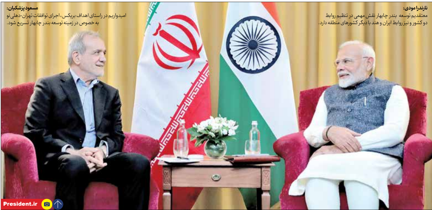
مسعود پزشکیان: امیدواریم در راستای اهداف بریکس، اجرای توافقات تهران-دهلی نو به خصوص در زمینه توسعه بندر چابهار تسریع شود.

مقامات لبنانی با رد بسته پیشنهادی فرستاده دولت بایدن، بر اجرای قطعنامه ۱۷۰۱ تأکید کردند.