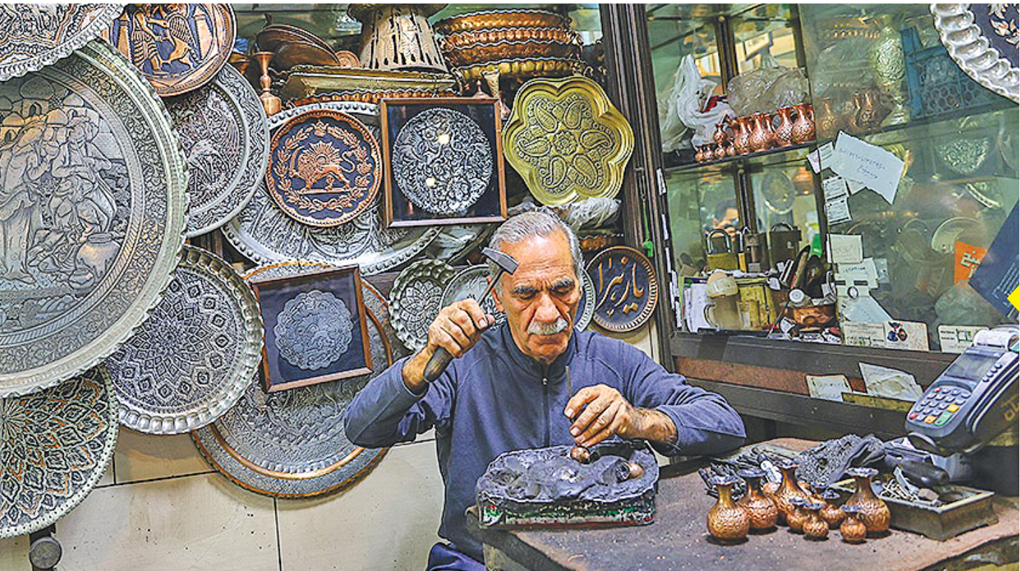
ثبت جهانی قلم‌زنی هنر قلم‌زنی اصفهان ثبت جهانی و نشان جغرافیایی بین‌المللی دریافت کرد. بعد از هنرهای «میناکاری»، «قلم‌کار»، «دکشی هفت‌رنگ»، هنر قلم‌زنی» اصفهان نیز به ثبت جهانی رسید.