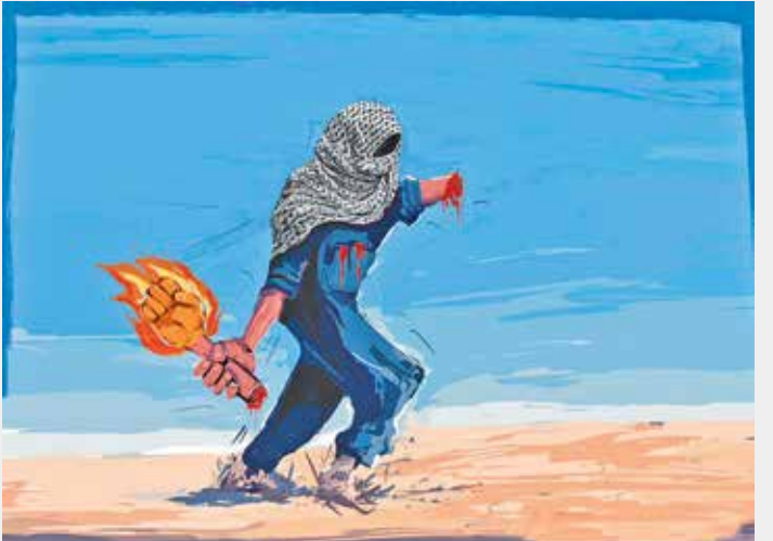
طراح: Mo Qasem