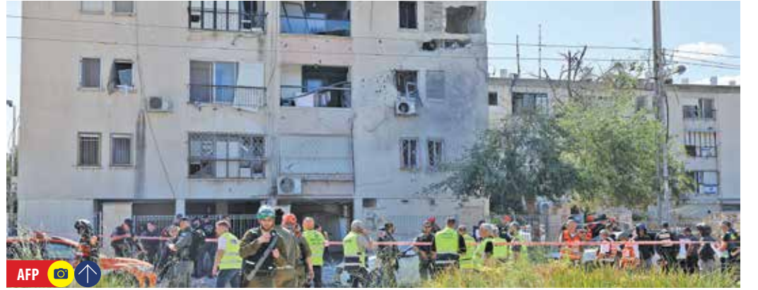
حمله موشکی سنگین حزب الله به حیفا و صفد