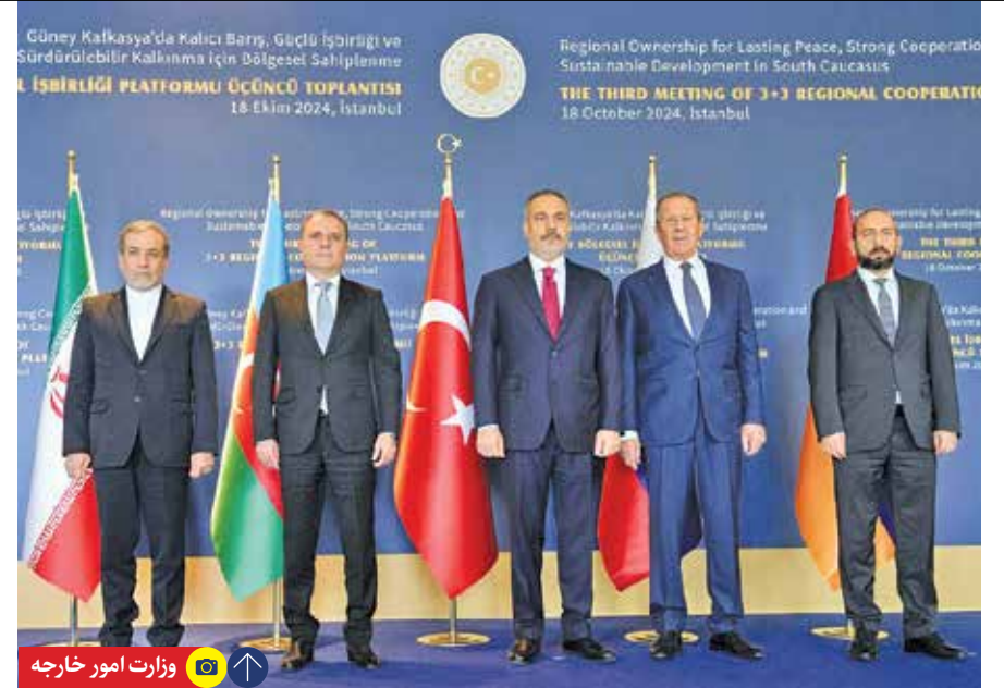
وزیر امور خارجه ایران بعد از اردن و مصر برای حضور در نشست ۳+۳ پیرامون قفقاز در استانبول حضور یافت