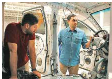
صبر، تمرین و عشق

تیونینگ مخصص خودرو خاصی نیست. اما بهتر است که یک تقسیم بندی انجام دهیم. اسلامی با تشریح تفاوت تیونینگ داخل و خارج از کشور می‌گوید: «خارج از کشور ماشین صفر را هم تیونینگ می‌کنند. یعنی حتی آخرین مدل‌ها هم بلافاصله تیونینگ می‌شوند. اما در ایران صبر می‌کنند خودرو از مدل بیفتد یا قدیمی شود، تازه وقتی وسیع خرید مردم به آن رسید این کار را انجام می‌دهند؛ البته بجز خودروهای آفرودی. صاحبان خودروهای آفرود همان لحظه اول خرید برای یک سری تغییرات سراغ تیون کردن می‌آیند. مثلاً رینگ و لاستیک‌های متفاوت تری می‌گذارند، ارتفاع خودرو را تغییر می‌دهند، کاور محافظ رنگ می‌گذارند، شیشه‌ها را تیره می‌کنند، سیستم صوتی بهتر می‌گذارند چون می‌خواهند از ماشینشان لذت ببرند.»