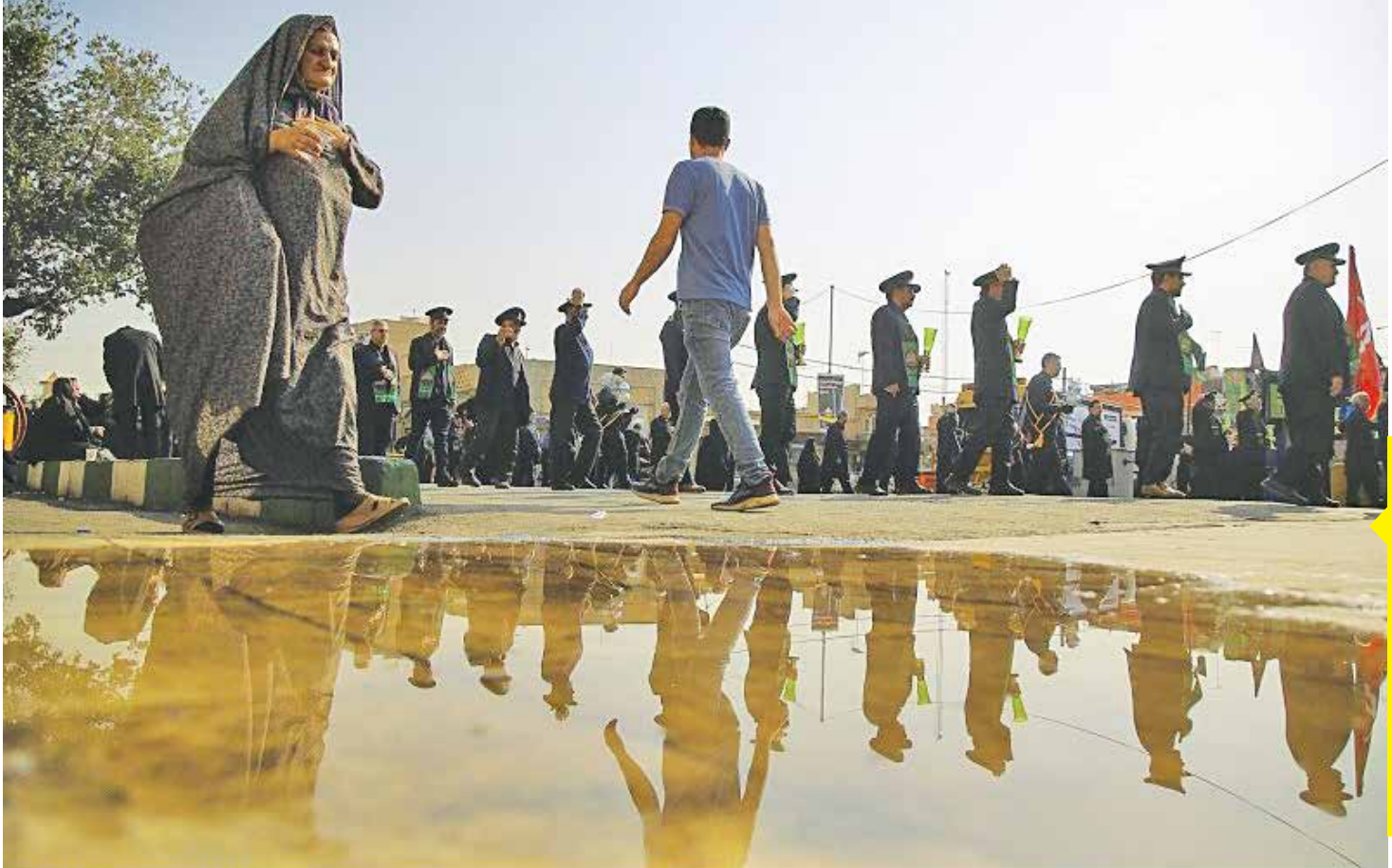
به مناسبت حضور فاطمه معصومه سلام الله علیها روزگشته (دوشنبه ۲۳ مهرماه) دسته عزاداری خادمان و زائران کریمه اهل بیت (ع) در شهر قم برگزار شد.