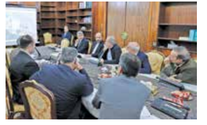
پژشکیان در نخستین جلسه «نهضت محرومیت زدایی از فضاهای آموزشی»: