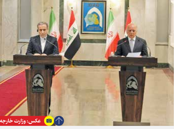
وزیر امور خارجه روز گذشته در آغاز دور سوم سفرهایش به بغداد رفت و دیدارهای مفصلی را با مقام های بلند پایه عراقی از جمله «عبدالطیف جمال رشیدی» رئیس جمهور و «فؤاد حسین» وزیر خارجه عراق از سر گذراند. او هدف سفر جدیدش را بحث و تبادل نظر با مقامات عراقی در مورد تحولات و رایزنی منطقه ای عنوان و تأکید کرد: «ما خواهان جنگ و تنش نیستیم اما آماده هر سناریویی هستیم»

عراقی پس از دیدار با فؤاد حسین، همتای عراقی خود در نشست خبری مشترک به وضعیت خطیر منطقه و ضرورت مشورت ایران با دوستانش در منطقه اشاره کرد و با تصریح اینکه رایزنی های بسیار خوبی صورت گرفت، گفت: «بسیار خوشحال شدم که موضع قاطع وزیر امور خارجه و دولت عراق را شنیدم که عراق اجازه نخواهد داد از فضای آن کشور علیه ایران یا هر کشور دیگری سوء استفاده شود و تهاجمی صورت بگیرد». رئیس دستگاه دیپلماتی بیان کرد: «این همان موضع دوستانه و برادرانه ای است که از دولت عراق انتظار داشتیم». رئیس دستگاه دیپلماتی ایران با تأکید بر اینکه جمهوری اسلامی ایران خواهان افزایش تنش، درگیری و جنگ نیست، یادآور شد: «اما کاملاً برای یک وضعیت جنگی آمادگی داریم. ما برای جنگ آماده هستیم و برای صلح هم آماده هستیم؛ این موضع قاطع ایران است». عراقی با تصریح اینکه «از جنگ نمی ترسیم ولی خواهان جنگ نیستیم»، ادامه داد: «برای صلح عادلانه در غزه و لبنان تلاش خواهیم کرد و در این موضع با دوستان خود در منطقه و به خصوص در عراق اشتراک نظر داریم. معتقدیم که جنایات و تهاجمات رژیم صهیونیستی باید زودتر متوقف و آتش بس برقرار شود.»