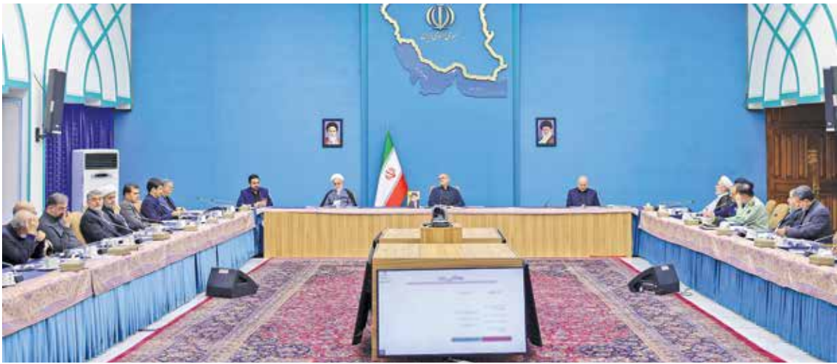
اولین جلسه شورای عالی فضای مجازی در دولت چهاردهم ۱۰ مهرماه برگزار شد

نیاز است. اینکه گفته می شود «تغییر» به زمان نیاز دارد، شبیه آن حرف های تکراری «باید به دولت زمان داد» نیست. تغییر به زمان نیاز دارد، چون تغییر هر وضعیتی، حاصل یک فرآیند مشخص است.