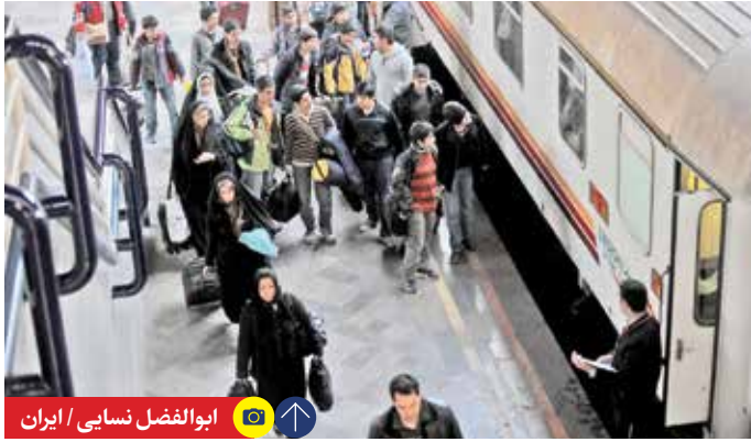
ابوالفضل نسایی / ایران

معاون وزیر راه و شهرسازی درباره برقی سازی راه‌آهن مشهد تأکید کرد: برقی سازی راه‌آهن