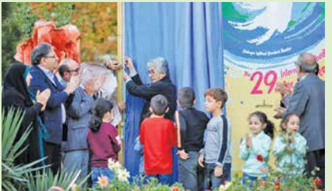
آیین رونمایی پوستر جشنواره تئاتر کودک و نوجوان در همدان برگزار شد

کانون پرورش فکری کودکان و نوجوانان استان همدان و دیگر مدیران استانی با یاد و خاطره شهدای کودک و نوجوان غزه در پوست‌باغ ایروان همدان برگزار شد. حمید نیلی، مدیرکل هنرهای نمایشی وزارت فرهنگ و ارشاد اسلامی در ابتدای این مراسم ضمن گرامی‌داشت یاد و خاطره شهدای دفاع مقدس، شهدای محور مقاومت و شهدای کودک و نوجوان غزه و قدرانی از برگزارکنندگان این جشنواره در استان همدان، بیان کرد: جشنواره تئاتر کودک و نوجوان آغازگر مسیری است که ما را به دنیای شیرین کودکان و نوجوانان هدایت می‌کند. به اعتقاد من «صدافت» محور اصلی دنیای کودکان است که می‌تواند برای ما الهام‌بخش باشد و اگر بیا این نگاه انسانی و عاطفی به واسطه تئاتر وارد این دنیای سرشار از پاکی و طراوت شویم می‌توانیم توسط هنرمندان ارزنده عرصه تئاتر، ترسیم‌کننده و بازوی مهمی برای تحقق آرزوها و آینده کودکان و نوجوانان سرزمین ایران باشیم. سیدمسعود حسینی، شهردار همدان و دبیر اجرایی بیست‌ونهمین جشنواره بین‌المللی تئاتر کودک و نوجوان همدان نیز با ایزاز خرسندی از بازگشت ستاد جشنواره به استان همدان توضیح داد: