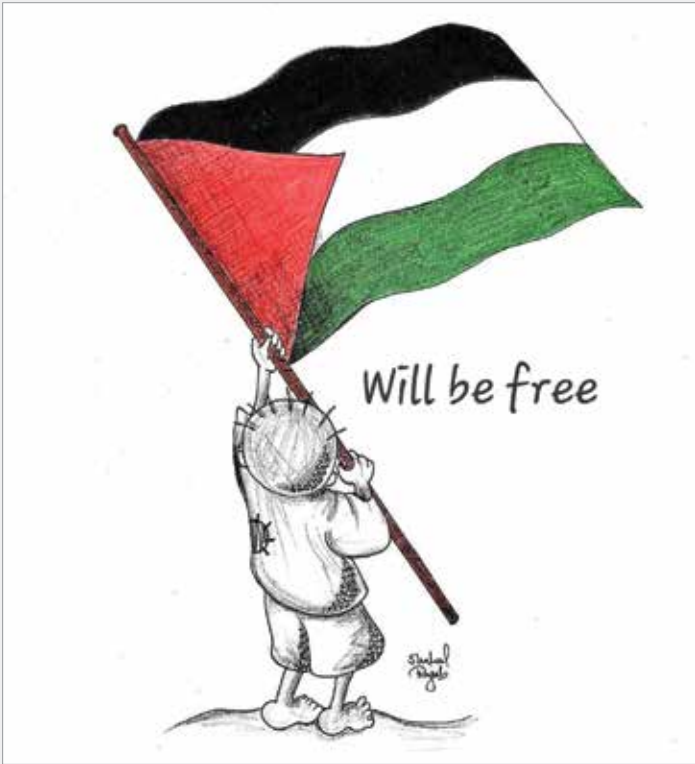
طراح: Shahd Rajab