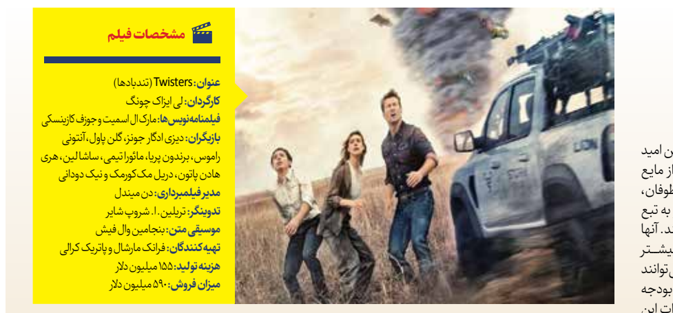
مشخصات فیلم Twisters (تندبادها) کارگردان: نیلی ایراک چوگ فیلمنامه‌نویس: مایکل لاسیت جوزف کازینسکی بازیگران: دیزی ادگار جونز، گلن پاول، آنه‌تونی راموس، برندن پریا، مانوآل آنتینی، ساشا لین هری هاد پاول، دریل مک‌گرومک و نیک دونای مدیر فیلمبرداری: دیوید مندل تدوینگر: تریلین. ا. شروپ شایر موسیقی متن: بنجامین وال فیش تهیه‌کنندگان: فرانک ماریال و پاتریک کرای هرنه تولید: ۱۵۵ میلیون دلار میزان فروش: ۵۹۰ میلیون دلار

برای مستندسازها، مرگ یک مظلوم است که می‌توان از زوایای مختلف به آن پرداخت و هر کس از دید خود آن را روایت کند