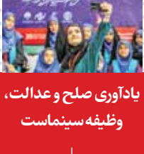
یادآوری صلح و عدالت، وظیفه سینماست

وزیر فرهنگ و ارشاد اسلامی در پیامی به سی و هشتمین جشنواره بین‌المللی فیلم‌های کودکان و نوجوانان از لزوم همدلی و همدردی سینما با کودکان مظلوم غزه و لبنان و یادآوری طعم صلح و عدالت در جهان از دریچه سینما نوشت. در بخشی از پیام سید عباس صالحی به این جشنواره آمده است: «سینما محصور در فرم، تکنیک و ساختار نبوده و نیست بلکه وظیفه دارد طعم صلح و عدالت را در پدیدار انسانی و جهان انسانی پدیدار کند. به گونه‌ای که از یکسو محروم‌ترین کودکان و نوجوانان ایرانی را در این رؤیای دست نیافتنی حاضر نموده و مشارکت دهد و از سوی دیگر بتواند همدلی و همدردی خویش را با کودکان مظلوم غزه و لبنان بازنمایی کند.»