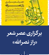
برگزاری عصر شعر «راز نصرالله»