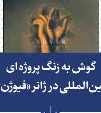
گوش به زنگ پروژه ای بین المللی در ژانر «فیژون»

«رهاشده» کتاب خاطرات «بوریس جانسون» نخست‌وزیر سابق بریتانیا، پیش از انتشار در صدر پرفروش‌های بریتانیا در وب‌سایت «آمازون» قرار گرفت. «گاردین» نوشت: «رهاشده» به فعالیت این سیاستمدار از دوران حضورش به عنوان شهردار لندن تا وزیر خارجه و نخست‌وزیر می‌پردازد. کتاب خاطرات «جانسون» به قیمت ۳۰ پوند و تعداد کمی از نسخه‌های انحصاری آن نیز با قیمت ۱۰۰ پوند فروخته خواهد شد. از دیگر آثار جانسون می‌توان به کتاب «عصر چرچیل» اشاره کرد که در دوران فعالیت او به عنوان شهردار لندن منتشر شده است.