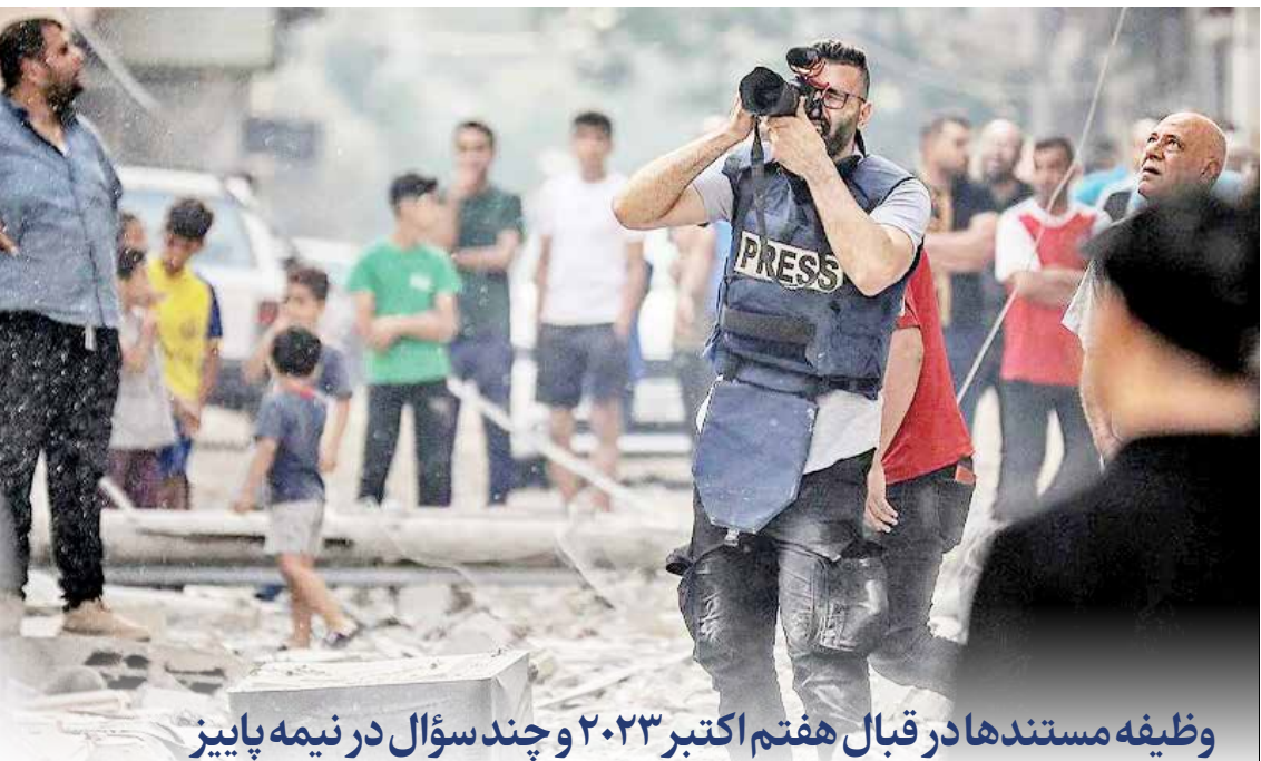
وظیفه مستندها در قبال هفتم اکتبر ۲۰۲۳ و چند سؤال در نیمه پاییز

عصر شعر سراسری «راز نصرالله» در گرامیداشت شهید مقاومت، سیدحسن نصرالله برگزار می‌شود. امروز به سالن اجتماعات کتابخانه مرکزی پارک شهر تهران یا محل برگزاری این برنامه در مراکز استان‌ها تصویربرداری و کادربندی می‌شود. این ویژه برنامه از شبکه اینترنتی کتاب آپارات هم به صورت زنده پخش می‌شود. / روابط عمومی