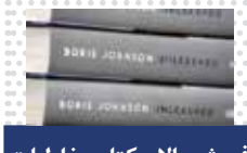
فروش بالای کتاب خاطرات «بوریس جانسون»

در حالی که علاقه‌مندان سینما منتظر اکران فیلم «قاضی شماره ۲» به کارگردانی کلینت ایستوود هستند، خبرها حاکی از آن است که این کارگردان ۹۴ ساله روی فیلم بعدی‌اش کار می‌کند. انتشار این خبر در حالی است که سال گذشته بحث خداحافظی او از دنیای سینما مطرح شده بود. او علاوه بر چندین دهه بازیگری، کارگردان فیلم‌های مشهوری چون «پل‌های مدیسون کانتی»، «ناخوشده»، «عزیز میلیون داری» و «تکت‌بیرانداز آمریکایی» است. / فارس