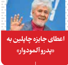
اعطای جایزه چاپلین به «پدرو آلمودوار»

پدرو آلمودوار، کارگردان مطرح اسپانیایی، پنجاهمین جایزه سینمایی چاپلین را برای فیلم «اتاق کناری» از مرکز فیلم لینکلن دریافت خواهد کرد. او این جایزه را به پاس داستان سرایی مشتاقانه و جسورانه با سبک بصری متمایز و رنگارنگ دریافت می‌کند. «اتاق کناری» که نخستین فیلم انگلیسی وی نیز محسوب می‌شود با بازی جولیان مور و تیلدا سوئیلتون در نقش دوستان قدیمی‌ای هستند که پس از تشخیص سرطان در یک آپارتمان مجلل با هم وقت می‌گذرانند. / ایستا