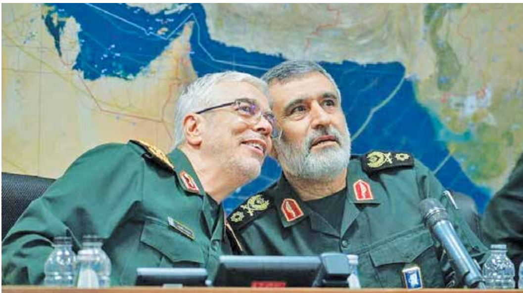
تصویری از اتاق عملیات وعده صادق ۲