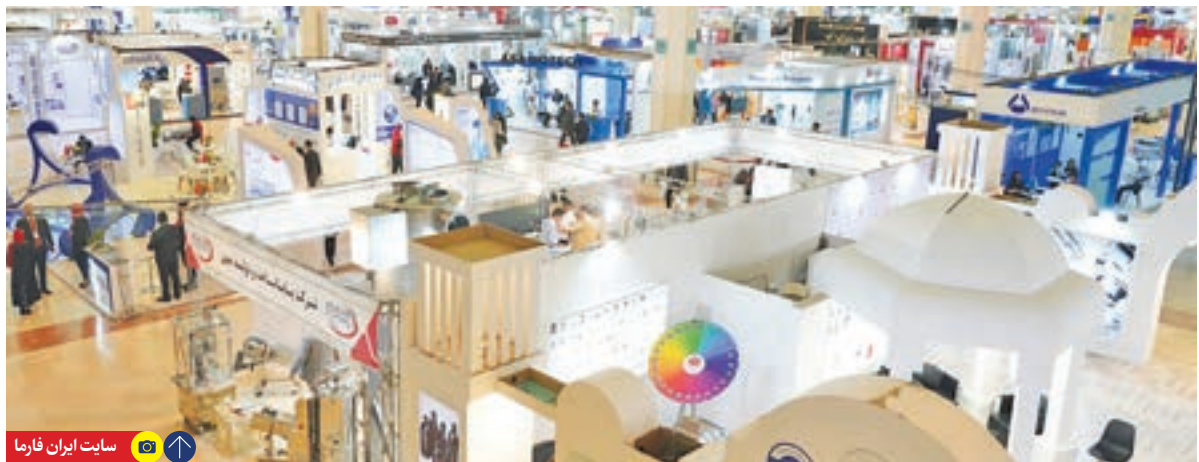
سایت ایران فارما

درخواست‌های خود را ارائه دهند. رئیس سازمان غذا و دارو در خصوص تخصیص ارز برای خرید ماشین‌آلات تا سقف ۲۰۰ میلیون دلار با معرفی از سوی سازمان هم گفت: این مهم اکنون امکان پذیر شده و تسهیلات ریالی به مبلغ ۵۰ هزار میلیارد ریال نیز در حال پیگیری است و بانک مرکزی وعده داده است که این مبلغ به شرکت‌های دارویی پرداخت شود.