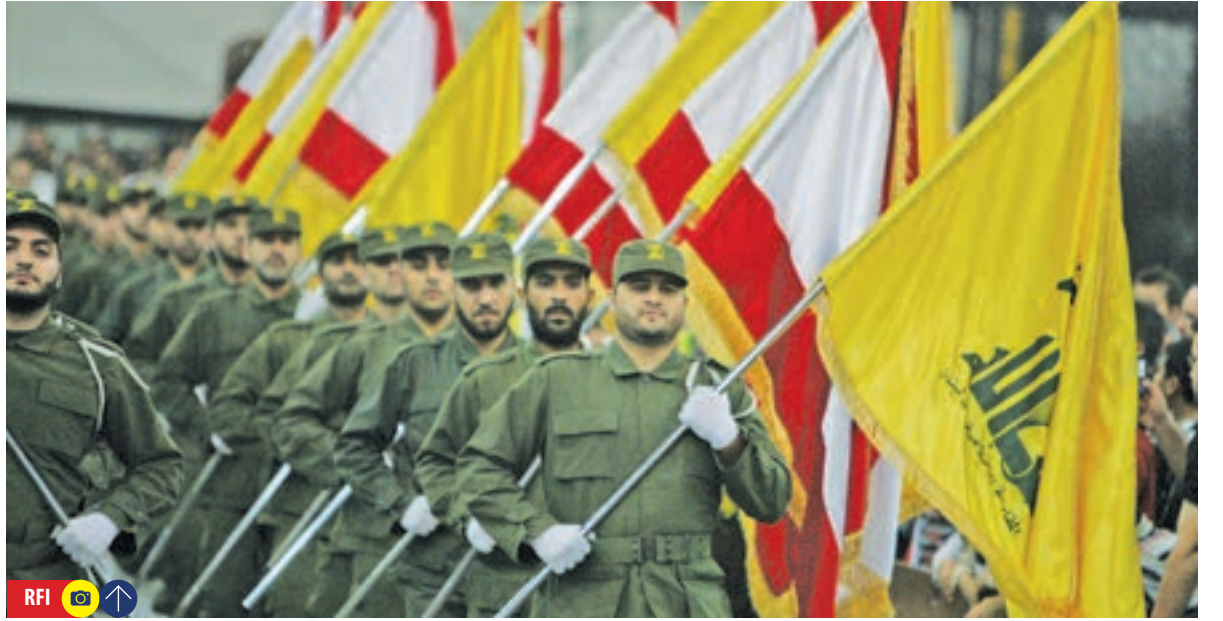
اسرائیل غرق در توهم پیروزی