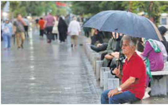
هشدار سیلاب در مازندران