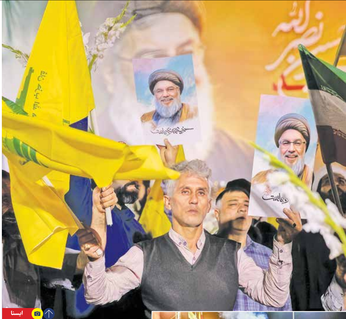
ایستاد و شهروندان تابعه استان با حضور مردم مؤمن و ولایت مدار برگزار شد.

کاروان شادی مردم مناطق و شهرستان های مختلف استان یزد نیز پس از پاسخ کوبنده جمهوری اسلامی ایران به رژیم صهیونیستی خیره کننده بود. جمعی از شهروندان دارالعباده یزد شامگاه سه شنبه با تجمع در حسینیه