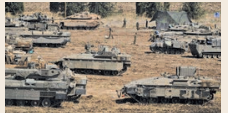
تانک های ارتش صهیونیستی پشت مرز لبنان قرار گرفته اند

شب گذشته رسانه امریکایی سی بی اس به نقل از یک مقام امریکایی که اشاره ای به نام او نشده گفت اسرائیل ممکن است طرف چند ساعت آینده عملیات در لبنان را آغاز کند. واشنگتن پست و نیویورک تایمز هم نوشته اند تل آویو تصمیم خود برای انجام یک «عملیات محدود» در لبنان را به اطلاع واشنگتن رسانده است.