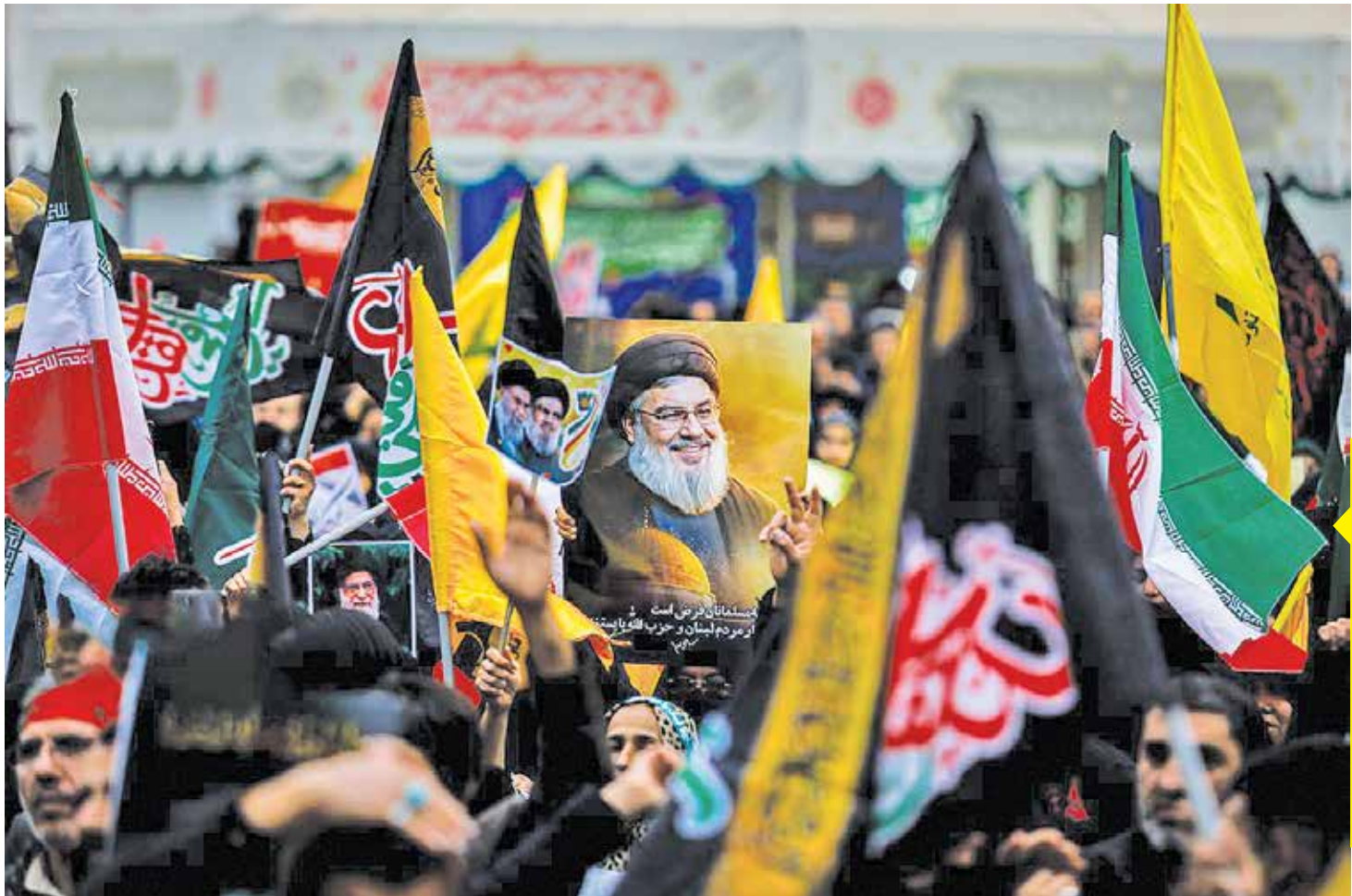
در پی شهادت دبیرکل حزب الله لبنان در تجاوز وحشیانه رژیم اشغالگر قدس به جنوب لبنان اجتماع بزرگ هزاران مجاوران حرم مطهر رضوی با عنوان «حزب الله زنده است» در میدان شهدای مشهد برگزار شد.