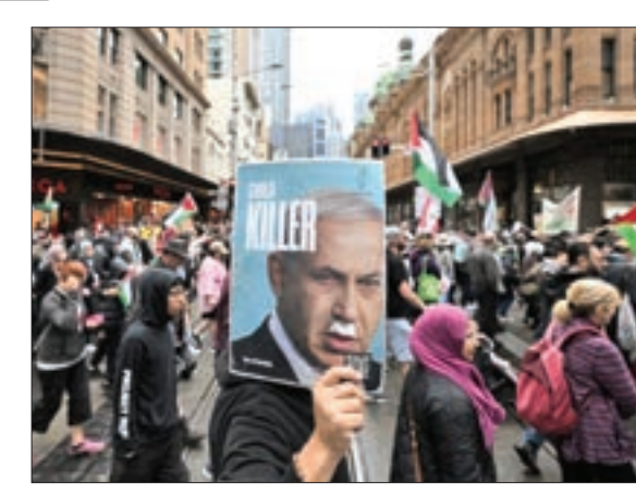
سیدنی - استرالیا

سناریوی مرگبار نوه برای سرقت طلاهای مادر بزرگ