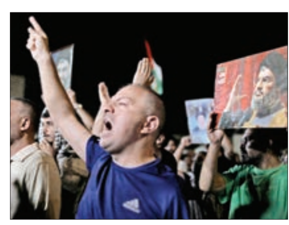
امان - اردن