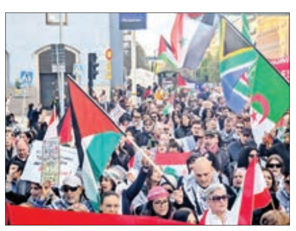
استکهلم - سوئد