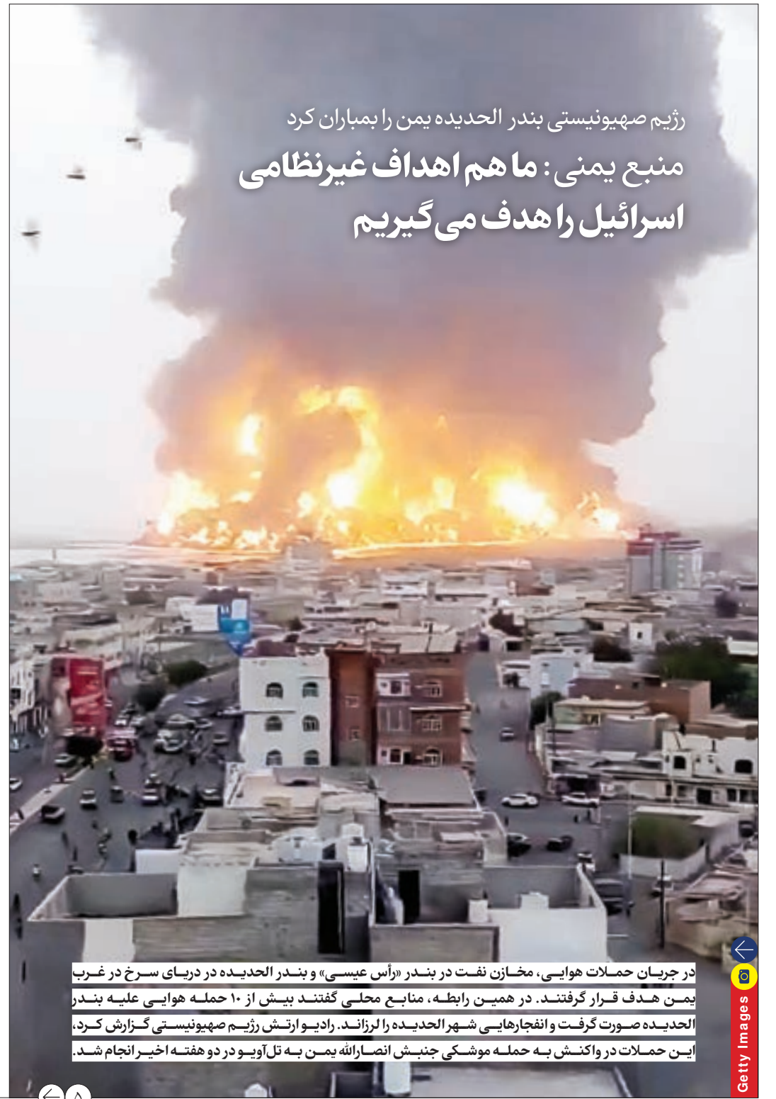
در جریان حملات هوایی، مخازن نفت در بندر «راس عیسی» و بندر الحدیده در دریای سرخ در غرب یمن هدف قرار گرفتند. در همین رابطه، منابع محلی گفتند بیش از ۱۰ حمله هوایی علیه بندر الحدیده صورت گرفت و انفجارهایی شهر الحدیده را لرزاند. رادیو ارتش رژیم صهیونیستی گزارش کرد، این حملات در واکنش به حمله موشکی جنبش انصارالله یمن به تل آویو در دو هفته اخیر انجام شد.

علیرغم حمایت های دولت ها و رسانه های غربی از اقدام اسرائیل در ترور دبیرکل حزب الله لبنان، افکار عمومی روز گذشته شهرهای مختلفی همچون سیدنی، کشمیر، هلسنکی، آینه هوون، ساوتپالو، کراچی، بغداد، امان، پاریس، ریاض، برلین و... را به صحنه حمایت از لبنان و فلسطین بدل کرد.