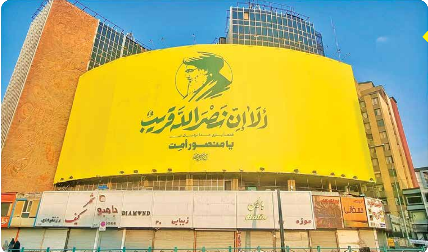
سرگاره یکشنبه در سوگ شهادت جانسوز سیدمقاومت، سیدحسن نصرالله از جدیدترین دیوارنگاره میدان ولیعصر (ع) رونمایی شد. در این دیوارنگاره «یا منصور امنت» که به پوش «آغاز نصرالله» اشاره دارد، تصویر شهید سید حسن نصرالله رهبر حزب‌الله لبنان ترسیم شده که آیه ۲۴ سوره بقره نیز زیر آن حک شده است: «الآن نصرالله قریب: قطعاً یاری خدا نزدیک است.» این دیوارنگاره کار مشترکی از دانیال فرخ و مجتبی‌بنامر زاده است.