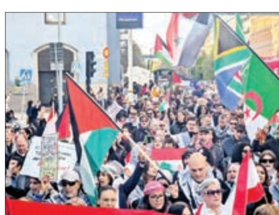
استکهلم - سوئد