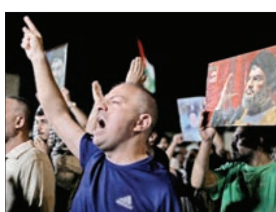
امان - اردن