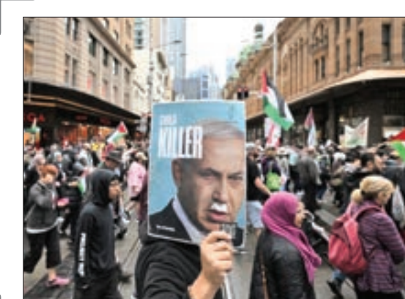
سیدنی - استرالیا