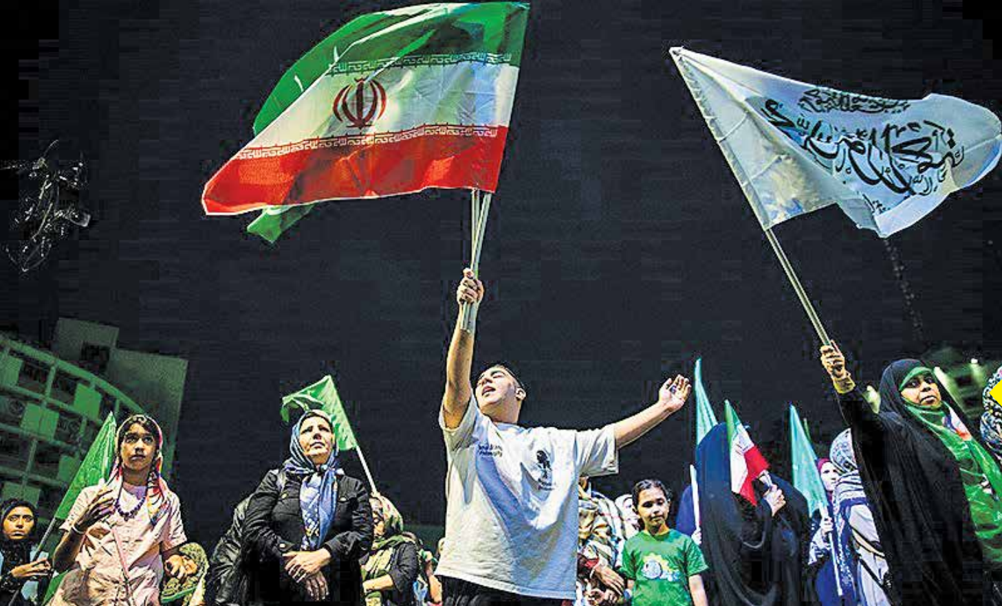
جشن میلاد پیامبر رحمت و مهربانی حضرت محمد (ص) شامگاه جمعه با حضور اقشار مختلف مردم از میدان هفت تیر تا میدان حضرت ولیعصر (عج) تهران برگزار شد.