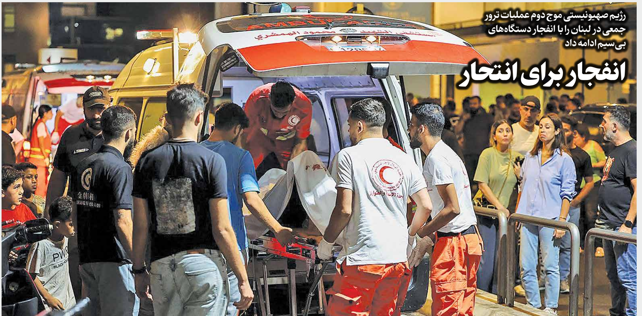
رژیم صهیونیستی موج دوم عملیات ترور جمعی در لبنان را با انفجار دستگاه‌های بی‌سیم ادامه داد

مقامات ایران ضمن محکومیت انفجارهای لبنان خواستار شدند | رژیم اسرائیل در جهان محکوم شود