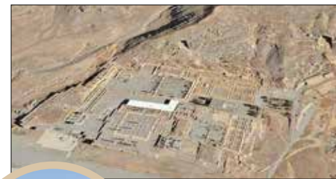
حکم قضایی، هخامنشیان در تخت جمشید را نجات می دهد؟