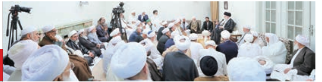
رهبر انقلاب در دیدار جمعی از علما، امامان جمعه و مدیران مدارس علمیه اهل سنت سراسر کشور: