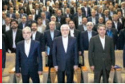
محمدرضا عارف صبح روز گذشته ۲۴ شهریور ۱۴۰۳، در اجلاس رؤسای دانشگاه‌ها و مؤسسات آموزش عالی، پژوهشی و فناوری کشور با اشاره به اینکه در حال حاضر در کیفیت دانشگاه‌ها در منطقه جایگاه دوم را داریم، تصریح کرد: آیا با این روندی که طی کردیم، می‌توانیم رتبه دوم مان را حفظ کنیم؟ باید رتبه اول را می‌داشتیم؛ نه منطقه نه دنیا صبر نمی‌کند ما پیشرفت کنیم، ما در منطقه‌ای پویا زندگی می‌کنیم که شاخص‌های پیشرفت بتدریج روند خوب و خوبی را طی می‌کند.