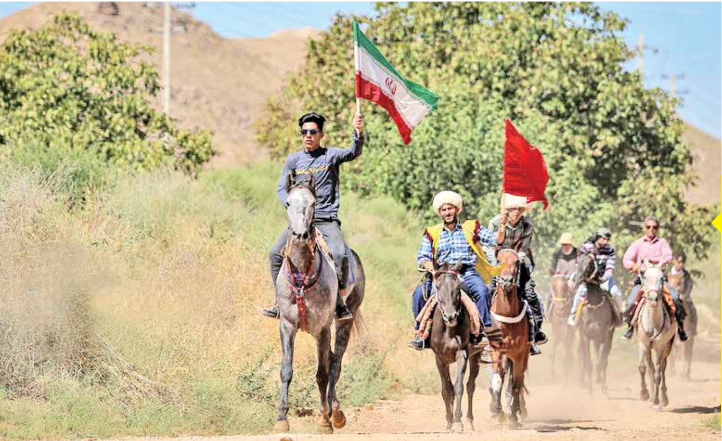
کاروان سوارکاران خراسان شمالی متشکل از ۱۷ اسب به همراه ۳۰ سوارکار در روزهای منتهی به شهادت امام رض (ع) فاصله ۲۶۰ کیلومتری بین بجنورد تا مشهد را طی می‌کنند تا در روز شهادت آن حضرت به حرم رضوی مشرف شوند.

مگر پریدن از روی آتش چهارشنبه‌سوری که هرساله هزاران نفر را به کام مرگ می‌برد، امروزه وجه عقلانی دارد؟ ولی ما با احترام به ارزش‌های باستانی آن، هر ساله آن را انجام می‌دهیم. نظیر این مراسم که به ظاهر بسیار ساده‌لوحانه می‌آید در قالب انواع کارنسال در اروپا نیز برگزار می‌شود که در واقع ریشه در باورهای باستانی دارد.