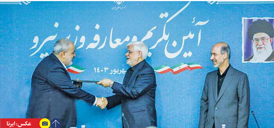
معاون اول رئیس جمهور در تکریم و معارفه وزیر نیرو:

مراسم تکریم وزیر نیرو در دولت سیزدهم و معارفه وزیر نیروی دولت چهاردهم، روز گذشته با حضور معاون اول رئیس جمهور در وزارت نیرو برگزار شد. محمد رضا عارف در این