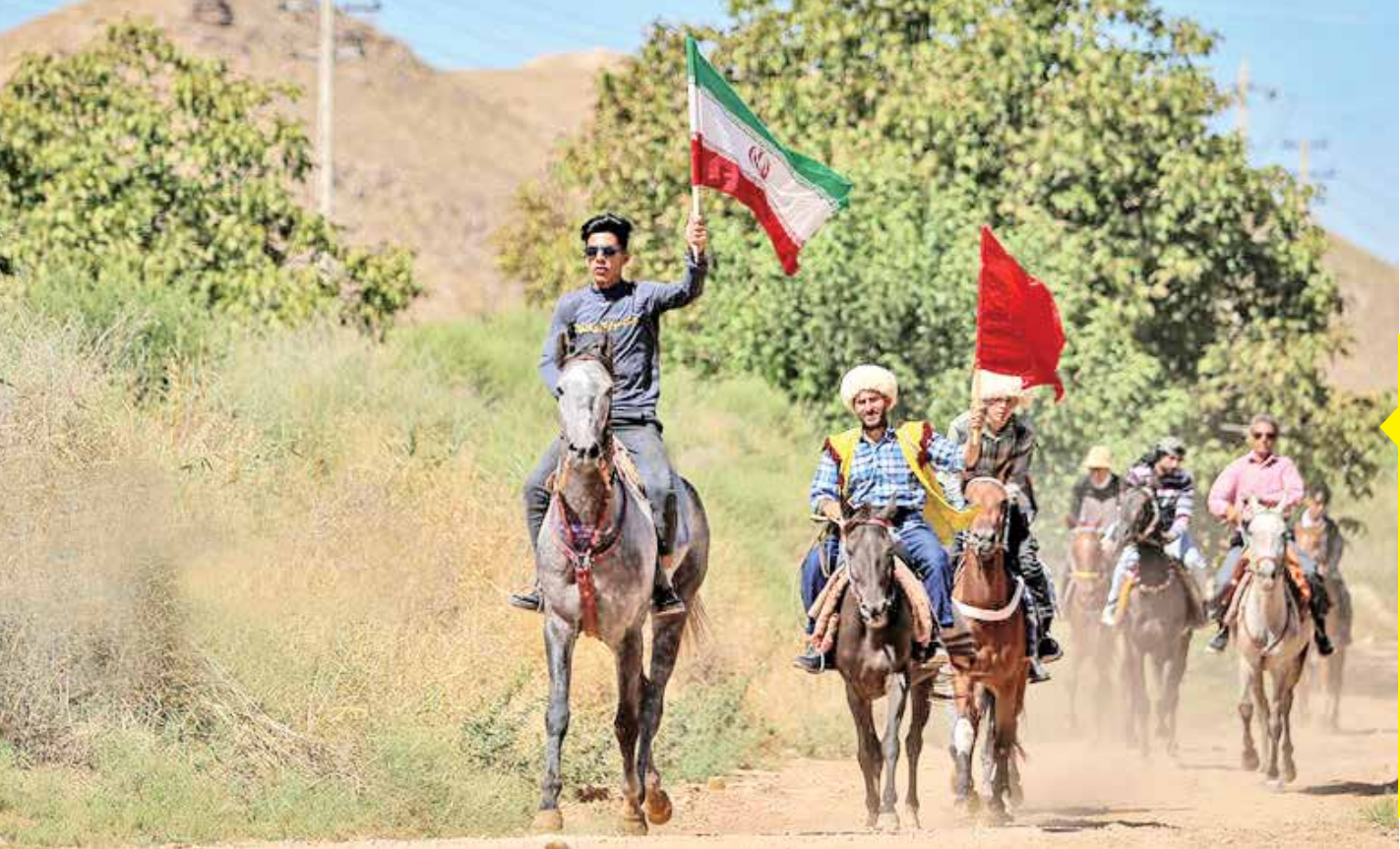
کاروان سوارکاران خراسان شمالی متشکل از ۱۷ اسب به همراه ۳۰ سوارکار در روزهای منتهی به شهادت امام رض (ع) فاصله ۲۶۰ کیلومتری بین بجنورد تا مشهد را طی می‌کنند تا در روز شهادت آن حضرت به حرم رضوی مشرف شوند.

مگر پدیدن از روی آتش چهارشنبه‌سوری که هرساله هزاران نفر را به کام مرگ می‌برد، امروزه وجه عقلانی دارد؟ ولی ما با احترام به ارزش‌های باستانی آن، هر ساله آن را انجام می‌دهیم. نظیر این مراسم که به ظاهر بسیار ساده‌لوحانه می‌آید در قالب انواع کارناوال در اروپا نیز برگزار می‌شود که در واقع ریشه در باورهای باستانی دارد.