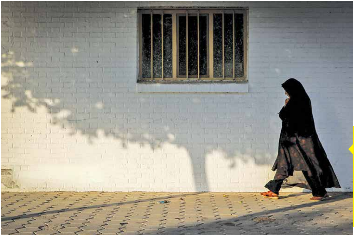
گرماي بی سابقه هوا در هفته‌های گذشته در ایران و جهان محسوس بود اما به تدریج گنبد حرارتی از روی کشورمان به سمت عراق و عربستان حرکت کرده و قدمها با سنگفرش خیابان و کوجه‌های شهر آشتی می‌کنند.

رضا علی پور، ملی پوش سنگ‌نوردی کشورمان که در شبکه‌های اجتماعی از او با عناوینی همچون «مرد عنکبوتی ایرانی» یاد می‌شود، با آنکه از صعود به فینال ماده سرعت المپیک پاریس بازماند اما همچنان، حتی حالا هم که المپیک تمام شده مورد توجه بسیاری از کاربران شبکه‌های اجتماعی است. این ورزشکار به تازگی در صفحه شخصی‌اش دست به بازنشر ماجرای از یک دهه قبل و درباره پیشنهادهی و سوسه‌انگیز زده است. او نوشته: «سال ۲۰۱۴ از امارات و امریکا پیشنهاده دادند زیر پرچم آنها مسابقه بدهم اما من ماندم. من به خاطر مردم و شهیدانی که برای کشور خون دادند ماندم. می‌دانستم در کشور امکاناتی ندارم اما نمی‌توانستم به خاطر پول زیر پرچم دیگر مسابقه بدهم.» با آنکه المپیک ۲۰۲۴ به پایان رسیده، اما مردم کشورمان همچنان با جمله‌هایی از او قدردانی می‌کنند؛ یکی از کاربران نوشته: «درد بر شرفت، ورزشکار باغیرت. زنده باد ایران،» دیگری این‌طور واکنش نشان داد: «رضا علی پور برای من در المپیک امسال یکی از محترم‌ترین ورزشکاران ایرانی شرکت‌کننده بود.» کاربر دیگری نوشته: «این همه عکس پسر خوش‌شکل ایتالیایی گذاشتن ذوق کردید، ولی ما خودمون رضا علی پور داریم.» دیگری گفته: «اگر رضا علی‌پور امکانات بهتری در اختیار داشت حتماً طلا می‌گرفت.»