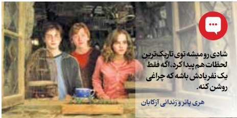
شادی رومی‌شده نوی تارنیک‌ترین لحظات هم پیدا کرد. که فقط یک تقریباتش باشه که چراغی روشن کنه.