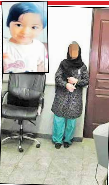
گروه حوادث / دادستان عمومی و انقلاب شهرستان الیگودرز از شناسایی قاتل «آی‌نور» کودک ۳ ساله الیگودرز با انجام اقدامات و بازجویی‌های فنی خبر داد.

وی ادامه داد: به دنبال پیدا شدن جسد این کودک در چاه فاضلاب همسایه ۴ نفر از اعضای این خانواده شامل ۲ زن و ۲ مرد برای انجام تحقیقات تکمیلی دستگیر شدند. پس از انجام بازجویی‌های فنی و تخصصی زن میانسال همسایه به قتل «آی‌نور» اعتراف کرد که پس از ثبت این اعترافات، متهم با صدور قرار بازداشت موقت تحویل زندان شد. دادستان الیگودرز با بیان اینکه تحقیقات تکمیلی به‌منظور بررسی علل و انگیزه قاتل از این اقدام هنوز در دست بررسی است، تصریح کرد: یکی دیگر از اعضای این خانواده که احتمال می‌رود شاهد این قتل بوده باشد برای بازجویی فراخوانده شده است که اظهارات این فرد می‌تواند در روند پرونده اثرگذار باشد. با هماهنگی‌های به‌عمل آمده صحنه قتل روز یکشنبه با حضور قاتل و خانواده مقتول بازسازی می‌شود و پس از تطابق اظهارات قاتل با جزئیات صحنه قتل اطلاعات بیشتر و دقیق‌تر در اختیار عموم مردم قرار خواهد گرفت.