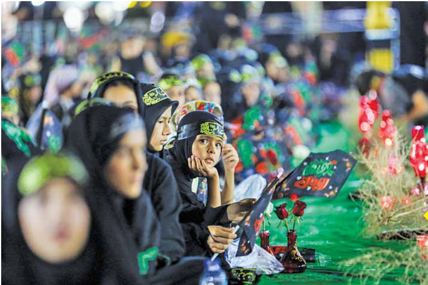
مراسم حضرت نمادین حضرت رقیه (ع) ، شامگاه شنبه بیستم مرداد ماه در مجموعه فرهنگی- تاریخی میدان امیرچخماخ بزرگ برگزار شد.