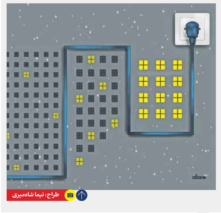
استفاده از برق را در ساعات اوج مصرف به حداقل برسانیم