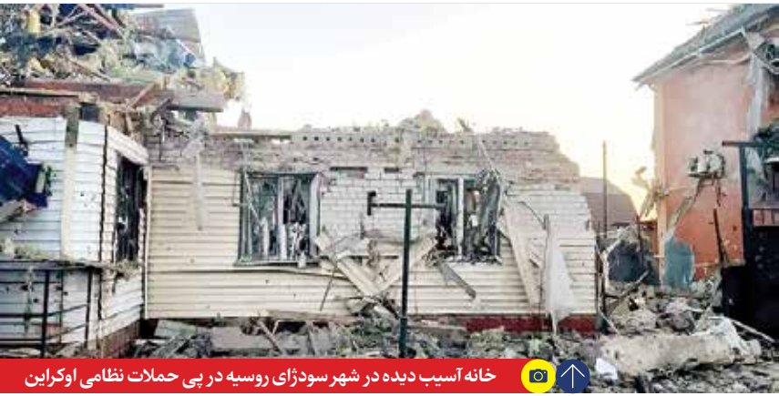
خانه آسیب دیده در شهر سودزای روسیه در پی حملات نظامی اوکراین

مسکو: ارتش روسیه در واکنش به حمله اوکراین به کورسک، خسارات سنگینی به دشمن وارد کرد