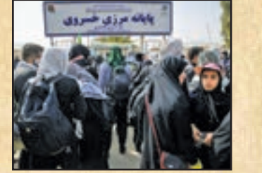
پایانه مرزی خسروی