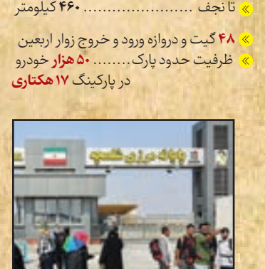
پایانه مرزی شملچه