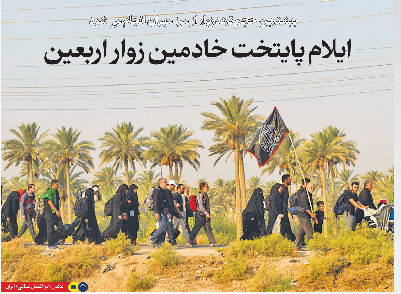
پیشترین حجم تردد زوار از مرز مهران انجام می شود