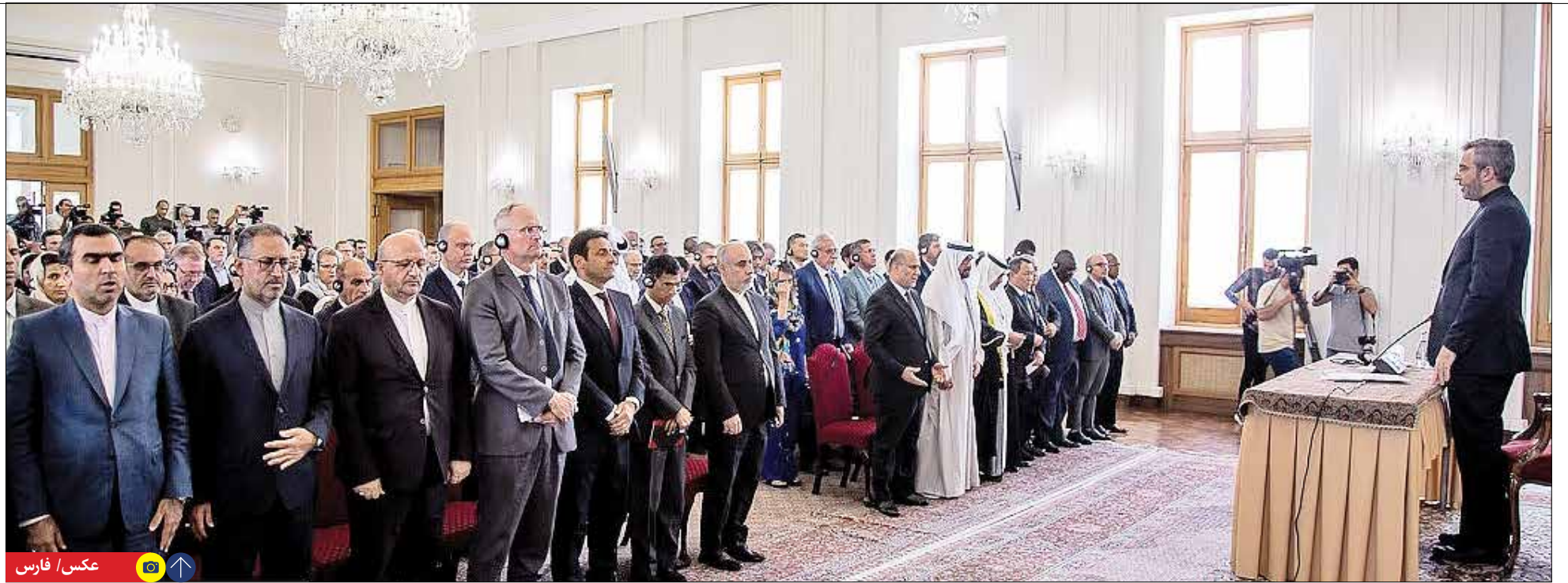
عکس / فارس

نشست سرپرست وزارت امور خارجه با سفرا و رؤسای نمایندگی های خارجی