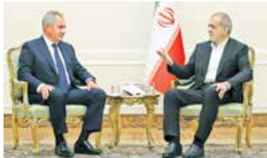
رئیس جمهور در دیدار دبیر شورای امنیت ملی روسیه: