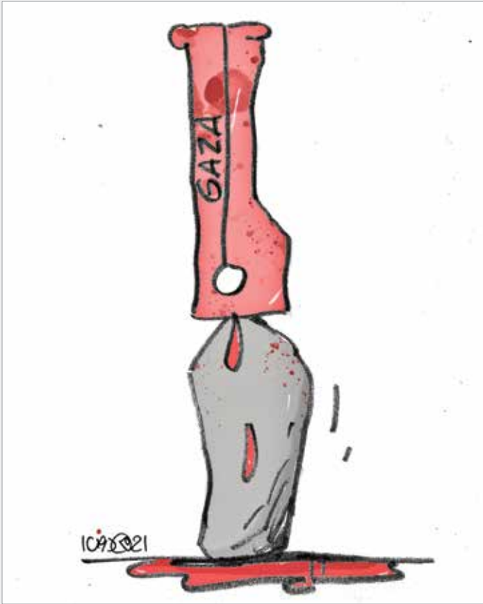
طراح: احمد رضا سهرابی