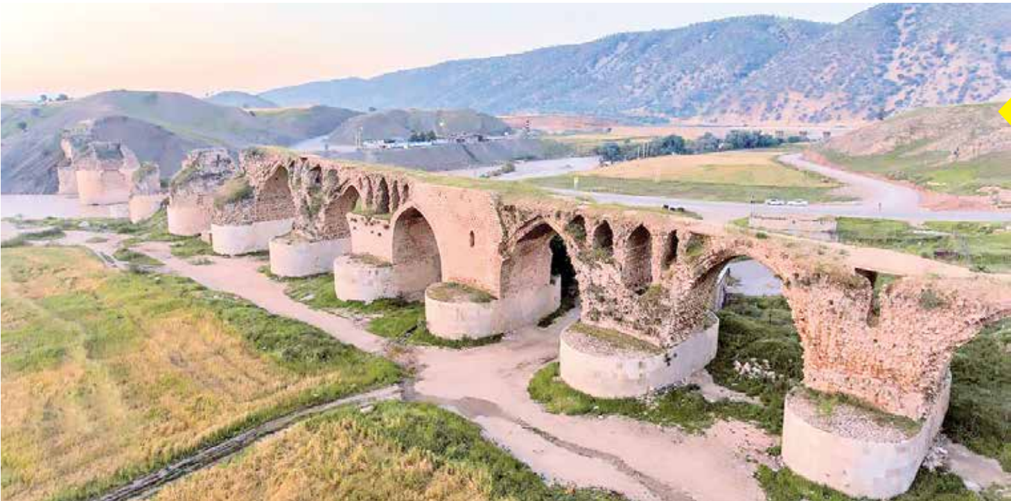
پل تاریخی کسکان در لرستان به دستور ایلخیم بدر این حسنیویه از سال ۳۸۹ تا ۳۹۹ ساخته شده و دارای قدمتی هزارساله است و جزو سه پل تاریخی در ایران است که دارای کتیبه‌ای به اندازه ۱۰۶ در ۹۲ است و به خط کوفی برگ‌دار، نوشته شده و مربوط به قرن چهارم هجری است. کتیبه پل کسکان با «بسم‌الله الرحمن الرحیم» آغاز و در هفت سطر نوشته شده است.