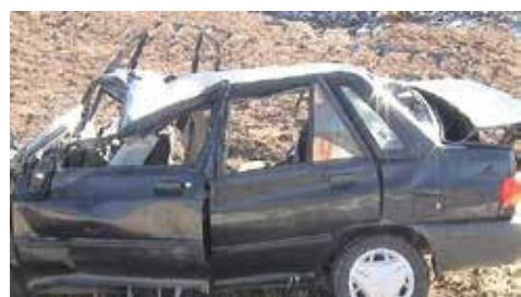
تصادف یک دستگاه سواری پژو با یک دستگاه پراید در محور روانسر - کرمانشاه ۳ کشته برجاست. سر عبدالحسین زارع، رئیس پلیس راه

استان کرمانشاه در تشریح این خبر بیان داشت: حوالی ساعت ۱۱ شب شنبه، یک دستگاه سواری پژو که از سمت روانسر به کرمانشاه در حال حرکت بود به علت سرعت غیر مجاز وارد مسیر مخالف شده و با یک دستگاه سواری پراید برخورد کرد و خودروی پژو آتش گرفت، در این حادثه راننده و سرنشین سواری پراید و راننده سواری پژو در دم فوت کردند. این مقام انتظامی در ادامه به رانندگان توصیه کرد: با رعایت نکاتی همانند حرکت با سرعت مطمئنه، رعایت حق تقدم، رعایت فاصله طولی، بستن کمربند ایمنی، اطمینان از سالم بودن خودرو از جمله سیستم ترمز و... از وقوع حوادث تلخ رانندگی پیشگیری کنند.