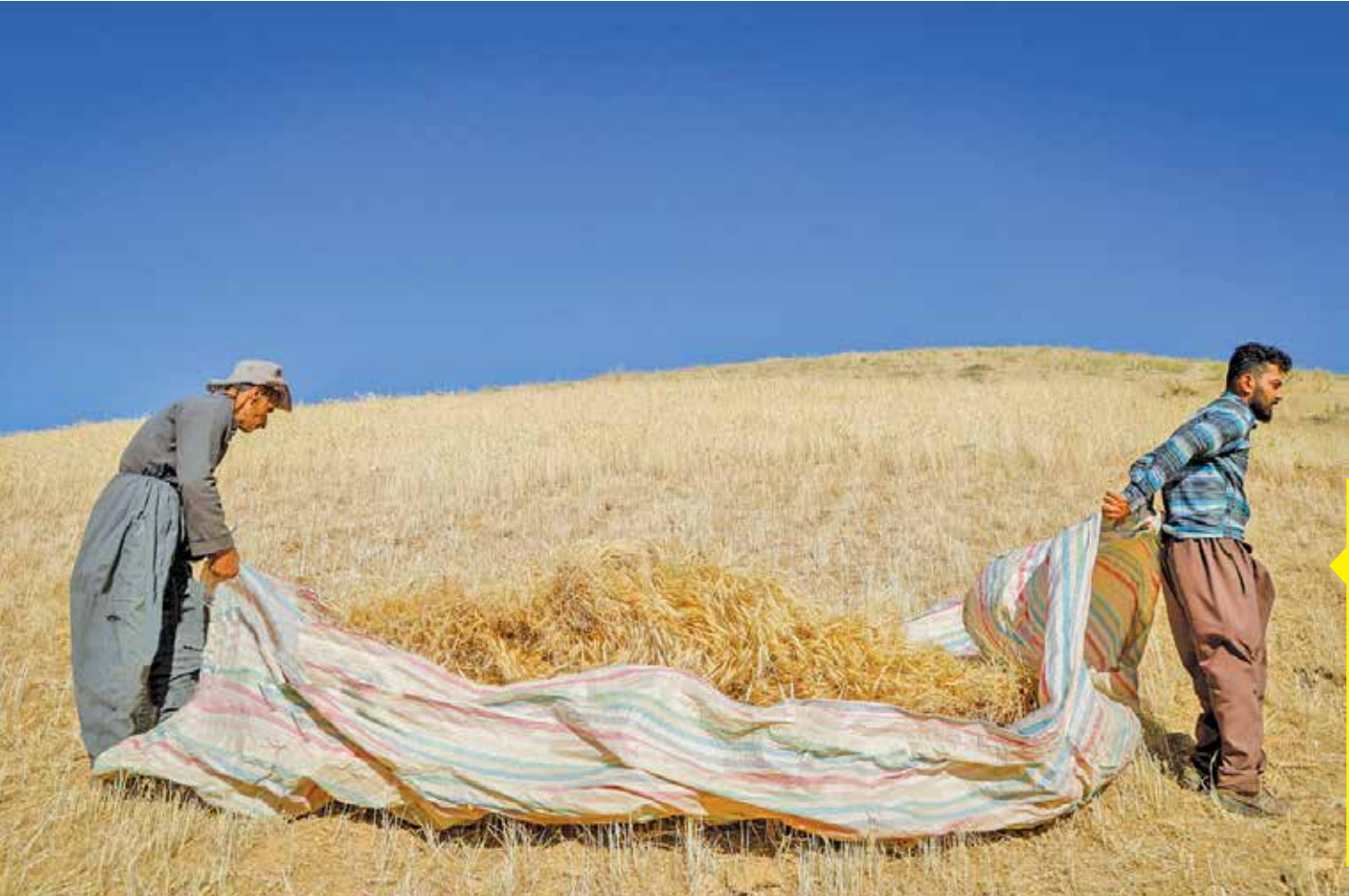
۶۲۶ هزار هکتار از اراضی کشاورزی استان کردستان در سال جاری به کشت گندم اختصاص دارد و پیش‌بینی می‌شود یک میلیون و ۵۰۰ هزار تن گندم برداشت شود.