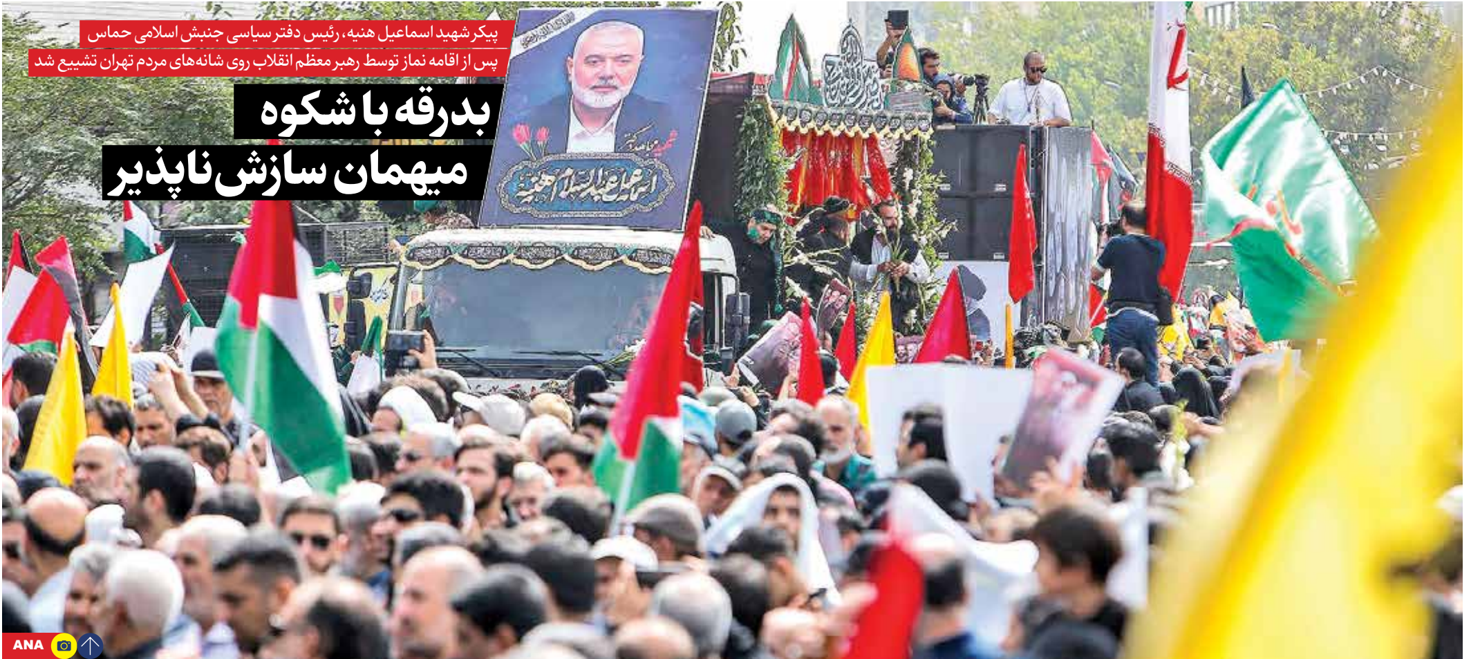
پیکر شهید اسماعیل هنیه، رئیس دفتر سیاسی جنبش اسلامی حماس پس از اقامه نماز توسط رهبر معظم انقلاب روی شانه‌های مردم تهران تشییع شد