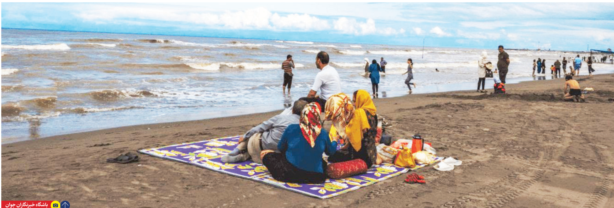
باشگاه خبرنگاران جوان

سواحل آزاد از شمال تا جنوب؛ یادگار رئیس جمهور شهید