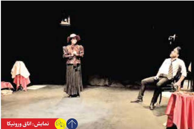
نمایش: اتاق ورونیکا