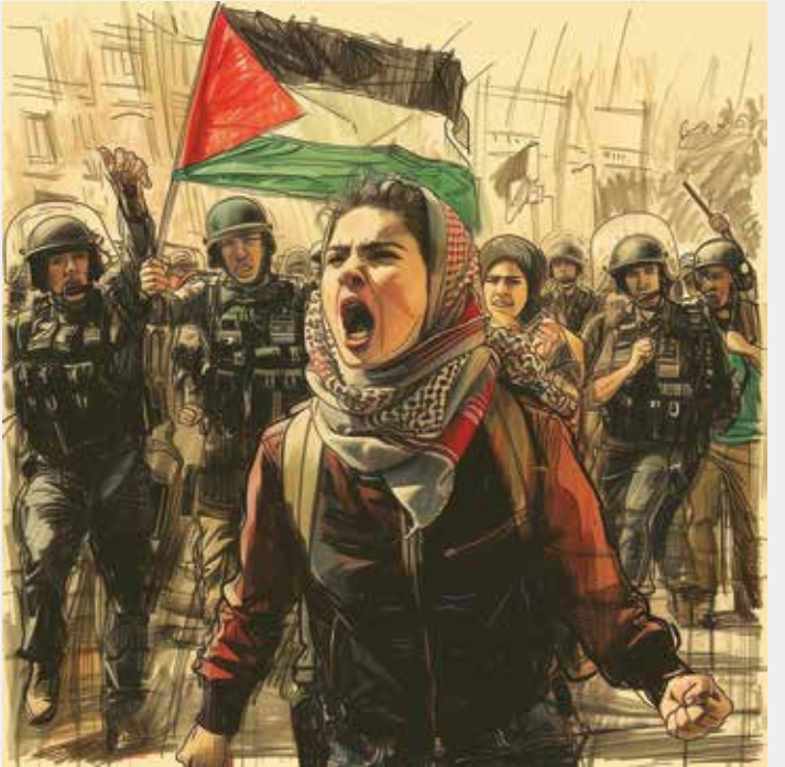
طراح: Awni Eshtaiwe