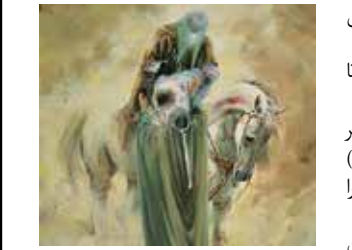
این نمایشگاه تا ۱۲ مردادماه برقرار است.

وی در توضیح اثری که به نمایشگاه آورده، گفت: مدتی بود که نماد دست در تولیدات هنری کنار گذاشته شده بود و این امر از نظر من چندان مطلوب نبود چراکه دست برای ما، وجه شیعی دارد، هرچند دست یا پنجه در دیگر هنرها و فرهنگ‌ها هم دیده می‌شود ولی غالب‌ترین آن در تشیع شکل گرفته و برای ما عدد ۵ و پنجه بسیار بالاهمیت است. اعداد در هنر اسلامی و فرهنگ اسلامی بسیار اهمیت دارند و ما به اعدادی چون ۵، ۱۲، ۱۴، ۱۹، ۲۸، ۴۰، ۷۲ و ۹۹ خیلی توجه می‌کنیم. عدد ۵ به نیت نج‌آل عبا اشاره دارد و نمادی از دست حضرت عباس (ع) است که در واقعه عاشورا قطع می‌شود و در جایی دیگر نماد دست حضرت زهرا (س) است. بنابراین ۵ برای ما در اسلام و هنر شیعی یک نماد و نشانه کاملاً مقدس است و من آن را انتخاب کردم تا در ترکیب با رنگ‌های گرم و عاشورایی یادآور