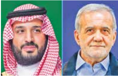
در گفت‌وگو تلفنی پزشکیان و محمد بن سلمان مطرح شد