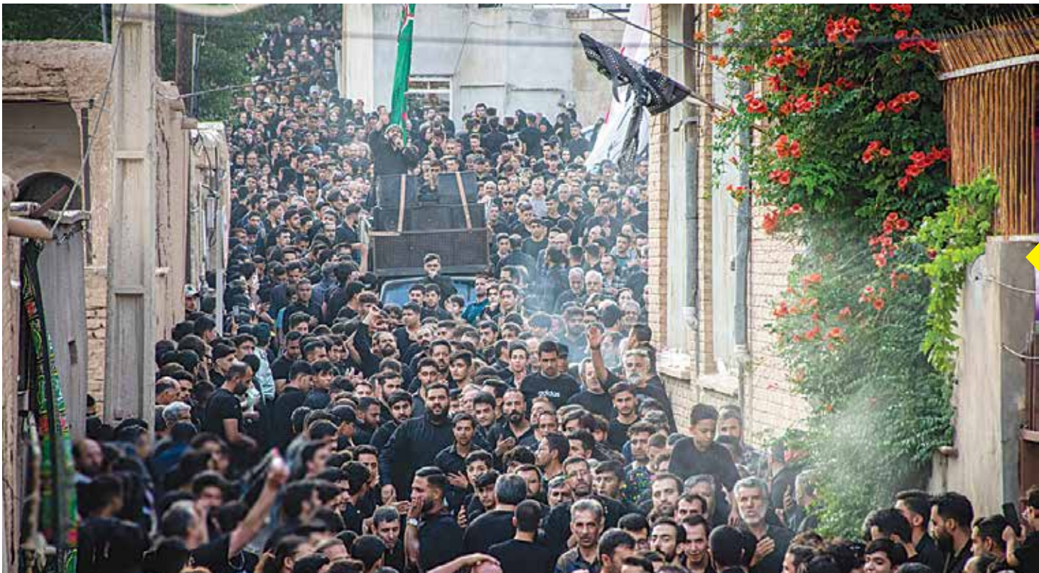
مراسم ویژه «با عباس یا عباس» با حضور جنات‌های مذهبی از سراسر استان سمنان در تکبیه تاریخی بازار شاهرود برگزار شد. این آیین کهن و دیرسال که قدمتی حدود ۲۰۰ تا ۳۰۰ ساله دارد، از صبح روز پنجم محرم در محله پیدآباد شاهرود آغاز می‌شود و سیل عزاداران با اجتماع عظیم در تکبیه بازار شاهرود مراسم سنتی و دیرینه «با عباس یا عباس» را برگزار می‌کنند.

ایام محرم و صفر که روزهای مهمی برای شیعیان محسوب می‌شوند و مجالس وعظ و عزای حسینی در هر کوی و برزن داشت با ارتباط گیری فراگیر عمومی ضمن بازنمایی مسائل کلیدی دینی، کارکرد دین برای امروز جامعه بشری را برجسته سازد. کتاب سفر شهادت حاوی سخنرانی‌ها، پیام‌ها و مقالات امام موسی صدر درباره واقعه عاشوراست. در این گفتارها امام موسی صدر به تبیین هدف امام حسین(ع) از این حرکت پرداخته است. همچنین گفتنی است او مثل سایر همفکران خودش در آن عصر مثل شهید مطهری به مسائل مربوط به آسیب‌شناسی سوگواری و عزادارداخته است و برخی زواید زیان‌ آور در این زمینه را گوشزد می‌کند. امام موسی صدر از درس- های این واقعه برای حل مشکلات جامعه، انسان‌سازی و تربیت انسان بهره‌ها برده، همچنین به نقش زنان بویژه حضرت زینب(س) در این واقعه پرداخته است.