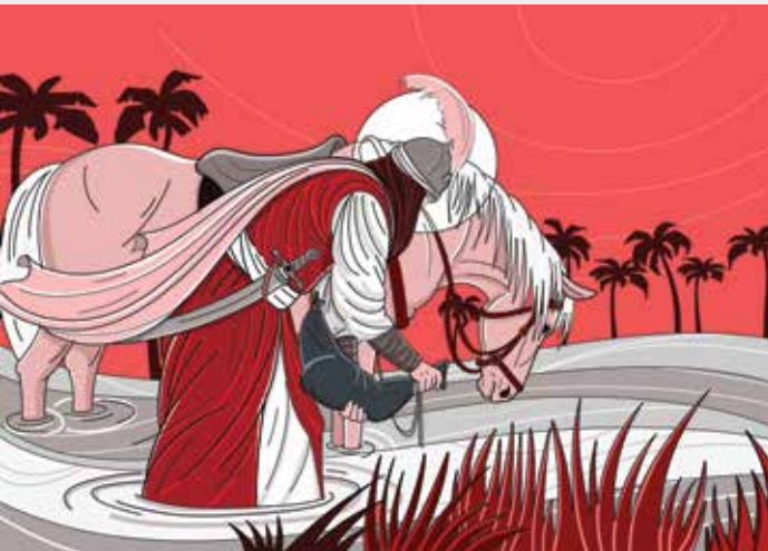
طراح: حمید صوفی