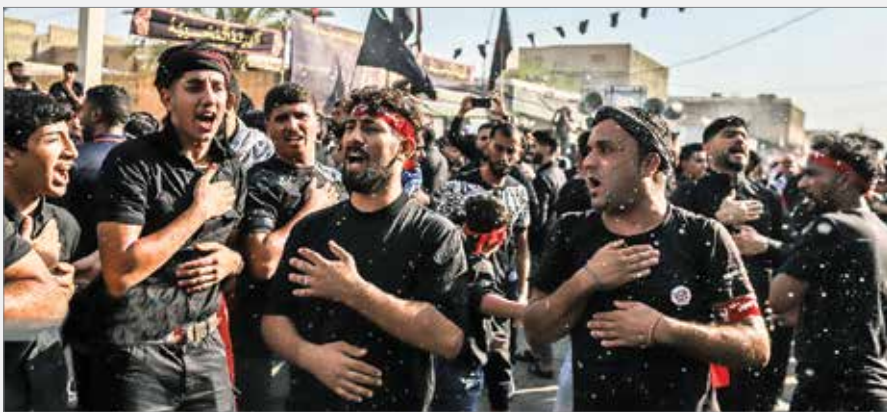
«ایران» در آستانه تاسوعا و عاشورای حسینی گزارش می‌دهد