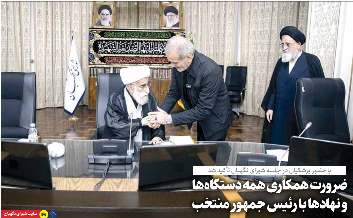
با حضور پزشکيان در جلسه شورای نگهبان تأکید شد