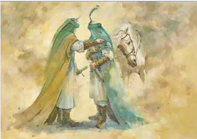
طراح: علی بحرینی