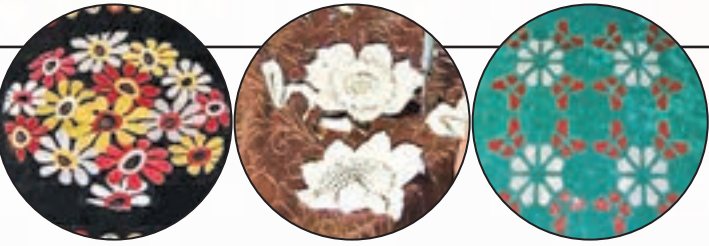
سوخته‌نگاری روی پارچه

انجام سوخته‌نگاری روی پارچه کمی مشکل است. باید به خاطر داشته باشید که هرگز نباید روی پارچه‌های ترکیبی (که از الیاف مختلف درست شده‌اند) یا پارچه‌هایی که از مواد شیمیایی مانند نایلون و پلی‌استر ساخته شده‌اند سوخته‌نگاری انجام دهید. فقط چند نوع محدود پارچه مانند کتان طبیعی برای سوخته‌نگاری مناسب هستند. همچنین پارچه‌هایی از جنس صددرصد پنبه برای سوخته‌نگاری مناسب هستند. سوخته‌نگاری روی پارچه نیاز به تمرین دارد و این کار باید با ملایمت و آهستگی انجام شود.