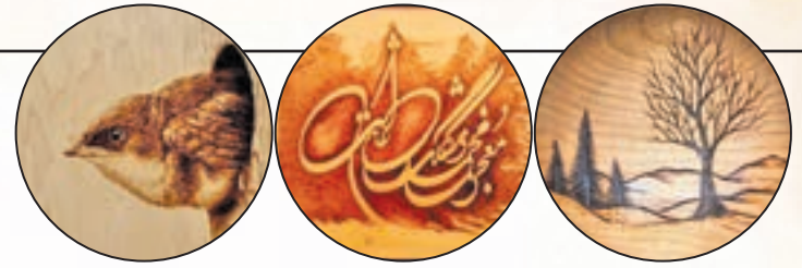
سوخته‌نگاری روی چوب

سوخته‌نگاری روی چرم بسیار لذتبخش است. چرم نسبت به چوب راحت‌تر می‌سوزد، زیرا مانند چوب در ساختار خود الیاف و بافت ندارد. الکتروود گرم شده حتی با دمایی پایین‌تر از دمای مورد نیاز برای سطح چوب به خوبی در سطح چرم فرو می‌رود و به شما امکان می‌دهد با سرعتی مناسب سوخته‌نگاری کرده و اثر هنری نهایی را در یک قاپ ارائه و همچنین می‌توانید از آن در موارد دیگری مانند قلابه سگ، کمر بند و کیف استفاده کنید. با این حال چرم معایبی هم دارد؛ ممکن است در مقایسه با چوب در حین سوخته‌نگاری کمی بدبو شود و خیلی سریع نوک الکتروود را کثیف کند، بنابراین دائماً نیاز به تمیز کردن نوک الکتروود خود دارید.