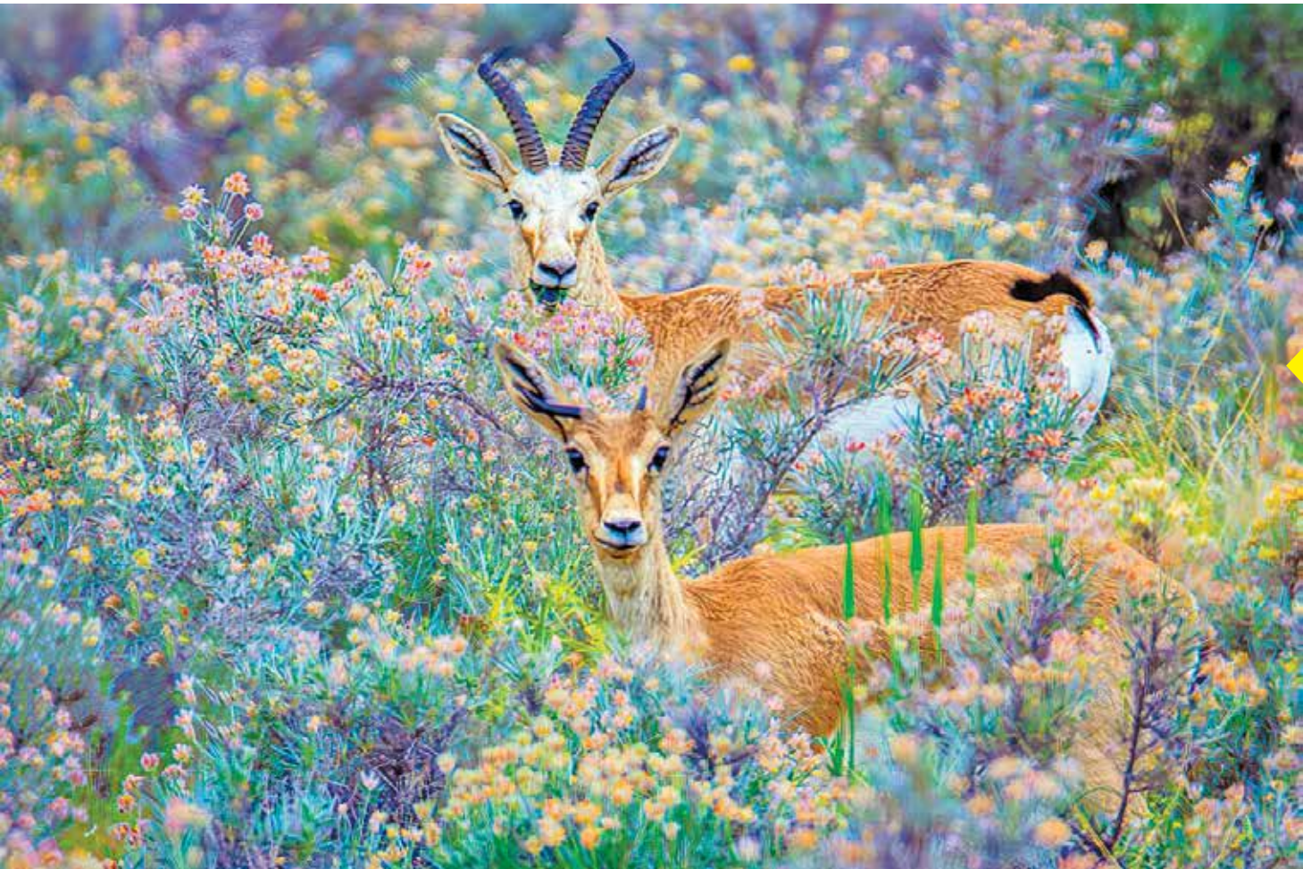
آهوی ایرانی یا آهوی گوانتردار ایرانی، نوعی آهوی بومی آسیای میانه و جنوب‌غربی آسیاست. گونه‌ای است از تیره گاوان و راسته جفت‌سم‌سانان یا بدن قهوه‌ای روشن که به سمت شکم تیره‌تر می‌شود و نواحی زیرین بدن آن سفید و دم آن سیاه است. این حیوان در صحرای گبی، بلوچستان پاکستان، جنوب شرق ترکیه، شمال آذربایجان و بخش‌هایی از ایران، عراق و افغانستان زندگی می‌کند. پناهگاه حیات وحش مونه (استان اصفهان) و پارک ملی بوم شیراز دو زیستگاه بزرگ آهوی ایرانی است.