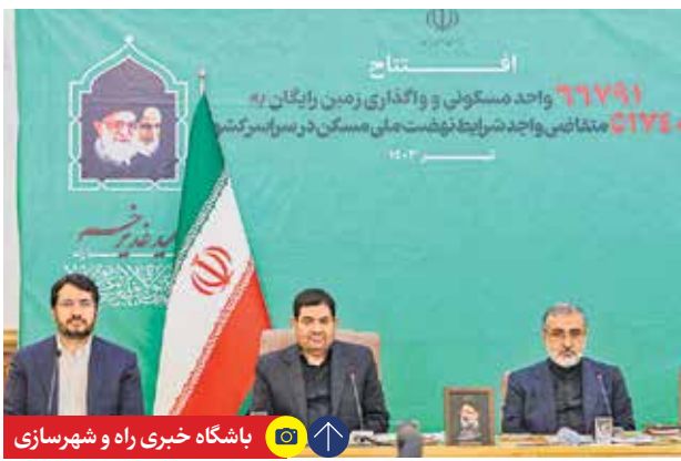
باشگاه خبری راه و شهرسازی

محمد مخبر، سرپرست ریاست جمهوری در آخرین نشست شورای عالی مسکن در دولت سیزدهم و در افتتاح طرح‌های مسکن و واگذاری زمین همزمان با این نشست گفت: شهید رئیسی در این سه سال تلاش کرد تا تدابیر رهبر معظم انقلاب روی زمین نماند. به تعبیر رهبر معظم انقلاب چنانچه این دولت ادامه پیدا می‌کرد، پیشرفت‌های خوب اقتصادی در کشور رقم می‌خورد. تحولات بخش مسکن در دولت سیزدهم بر اساس آمار و ارقام در جهت تولید و رشد بخش مسکن، مثبت و قابل توجه است. رشد بخش مسکن و ساختمان از منفی ۶۹ درصد در سال ۱۴۰۰ به مثبت ۷۱ درصد در سال ۱۴۰۲ رسیده است. همچنین متوسط