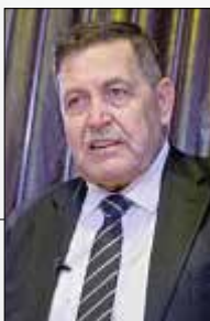
سرلشکر حسن حسن