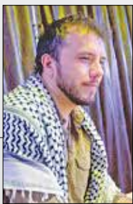
متحد مادر مسأله فلسطین بود

ما در برزیل می‌گوییم ایران کشوری است که همواره علیه و در زمینه صلح و عدالت برای شهادت آقای رئیسی، با توجه به اینکه آقای لولا دا سیلوا، رئیس جمهور برزیل، متحد خیلی خوبی برای ایران است و دوست ایران محسوب می‌شود، رسانه‌های فعال کشور ما نوشتند کسی که بیشترین همبستگی را با فلسطین داشت و بیشترین کمک و حمایت را از آنها می‌کرد، درگذشت.