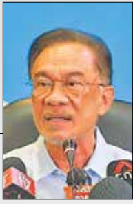
الگوی تعهد به رفاه و عزت مردم

من افتخار ملاقات با رئیس جمهور رئیسی را در حاشیه مجمع عمومی سازمان ملل گذشته داشتم. او الگوی تعهد عمیق به رفاه مردم و عزت ملت خود بود که نشان‌دهنده تمدنی غرورآفرین و غنی است که ریشه در اصول