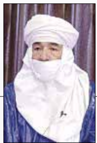
مردی شجاع در برابر استکبار بود

مرحوم آقای سید ابراهیم رئیسی برای خدمت به ملت و ایشان همواره از فلسطین دفاع و حمایت جمهوری اسلامی از مقاومت را اعلام می‌کرد و به‌رغم فشارهایی که دنیا به ایران و به مقاومت می‌آورد، هرگز دست از این حمایت چه در فلسطین، چه در لبنان یا هر جای دیگری برنداشت. ما به خاطر مواضع شجاعانه جمهوری اسلامی ایران و شخص ایشان در حمایت از مقاومت و ملت‌های تحت ستم و مردم آسیب‌پذیر جهان