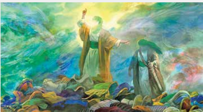
طراح: حسن روح‌الامین