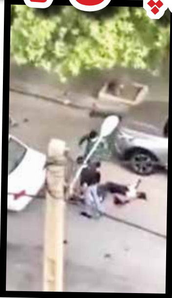
صحنه قتل مرد جوان در سعادت آباد تهران

گروه حوادث مرضیه همایونی/ پسر جوان ۴ سال پس از قتل برادرش به دست مردان شورور در اقدامی کینه جویانه دو نفر از عاملان جنایت را با همدستی دوستانش به رگبار بست، اما در کمتر از یک هفته دستگیر شدند.