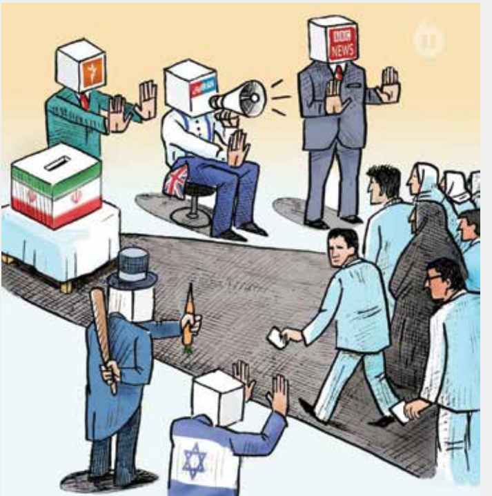
طراح: حسین نقیب