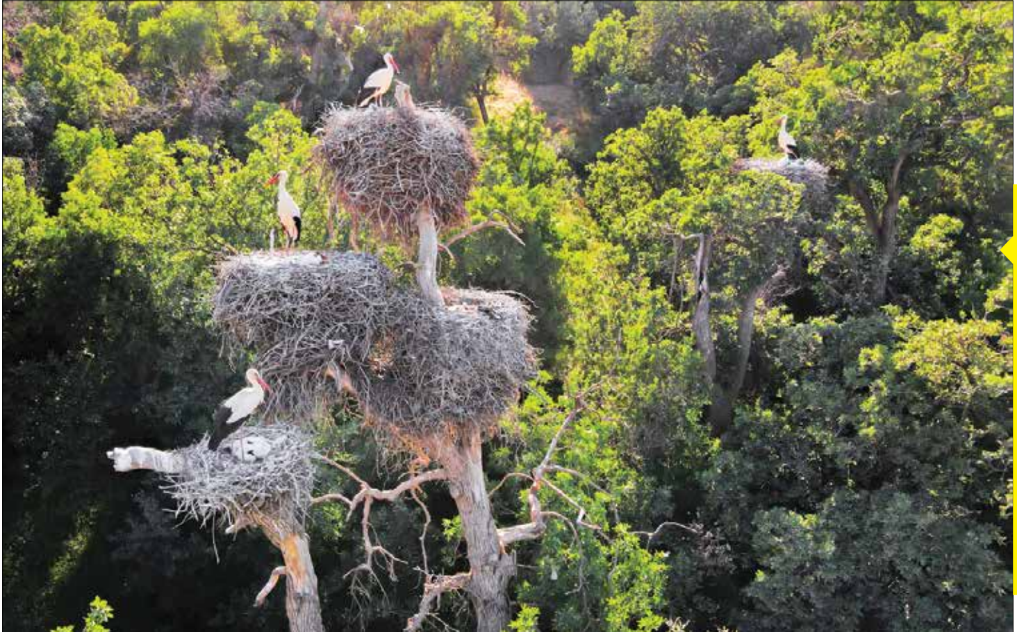
روستای دره‌تقی از توابع بخش مرکزی شهرستان مریوان در استان کردستان به شمار می‌رود و به روستای لک‌لک‌ها شهرت دارد. این روستا در کنار دیگر جاذبه‌های گردشگری و طبیعی، هرساله میزبان لک‌لک‌هایی می‌شود که در مسیر کوچ خود در این مکان اتراق می‌کنند. اهالی روستا آنها را حاجی لک‌لک می‌نامند. این پرندگان بر بالای درختان بلوط و نیرک‌های مخصوصی که توسط اهالی روستا برای لانه‌سازی ساخته شده‌اند خانه‌سازی می‌کنند.