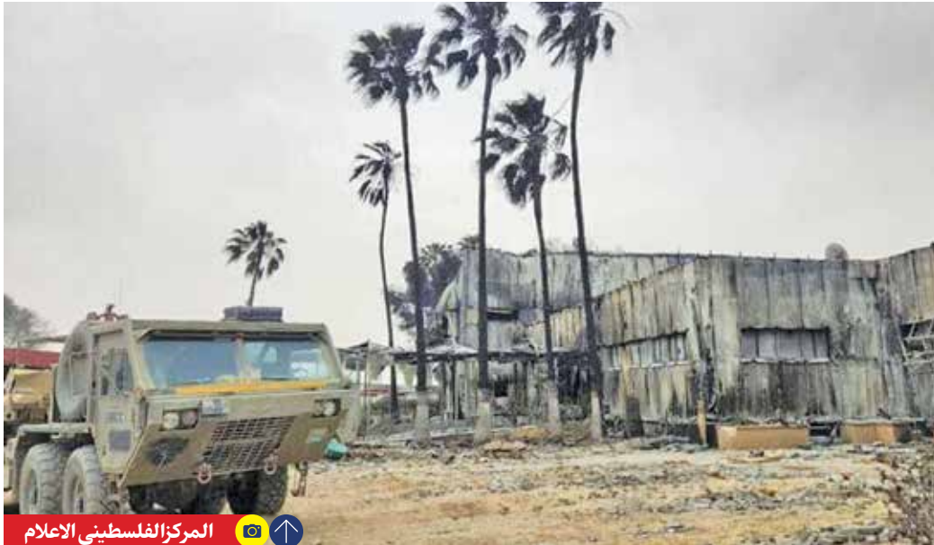
المركز للفلسطینی الاعلام

روزنامه عبری زئان دیدیوت آحرانوتو به نقل از یائیر سوکرمن سرهنگ ارتش رژیم صهیونیستی بیان کرد که تعداد تونل‌های حماس در شهر رفح بسیار زیاد است و حماس دوربین‌های زیادی در شهر رفح نصب کرده تا نبرد در این شهر را از زیر وری زمین اداره کند. او همچنین گفت بمب‌گذاری خانه‌ها و ساختمان‌ها در رفح قبیل از ورود نیروهای اسرائیلی، یکی از تهدیداتی است که ارتش رژیم صهیونیستی در این شهر با آن روبه‌روست.