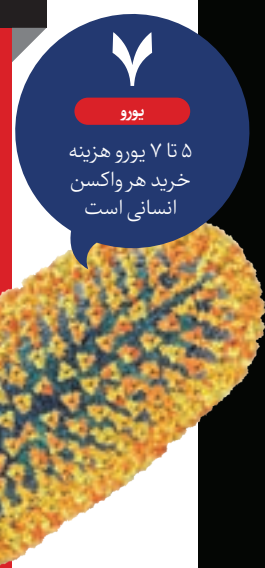
بورو ۷ تا ۵ بورو هزینه خرید هر واکنش انسانی است

چون می‌خواهد نسلش قوی‌تر باشد. غذا دادن به حیوانات خارج از خانه، صرفاً باید در مورد گونه‌های در خطر انقراض و زیر نظر محیطانی صورت گیرد.