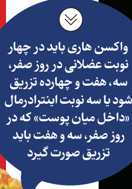
واکنش‌های باید در چهار نوبت عضلانی در روز صفر، سه، هفت و چهارده تزریق شود یا سه نوبت اینتردال «داخل میان پوست» که در روز صفر، سه و هفت باید تزریق صورت گیرد